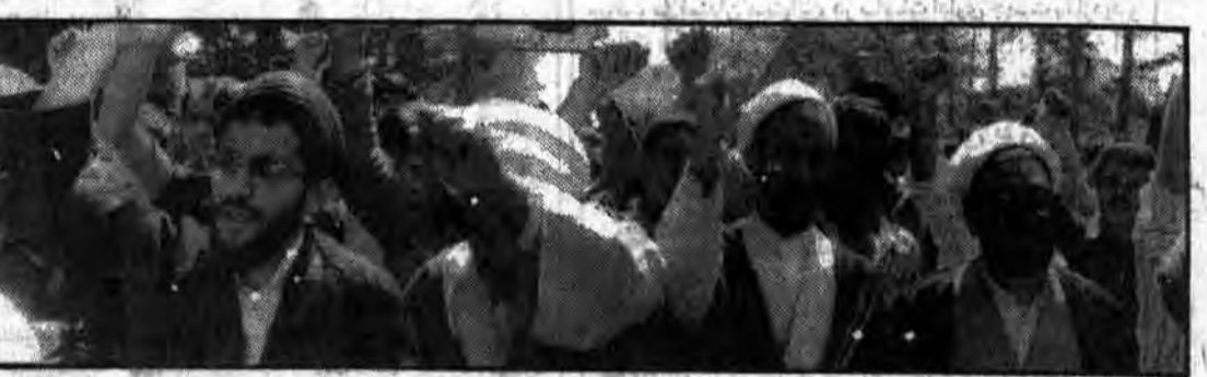
طی شش روز نبرد تن‌به‌تن با گشته و زخمی شدن بیش از ۵۰۰۰ معنی و اسارت ۱۱ نظامی

کلاسهای آموزش مواضع در شاخه مهندسیان و مهندس یاران حزب جمهوری اسلامی