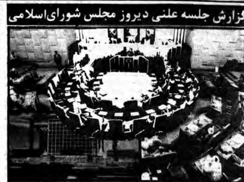
گزارش جلسه دیروز مجلس شورای اسلامی