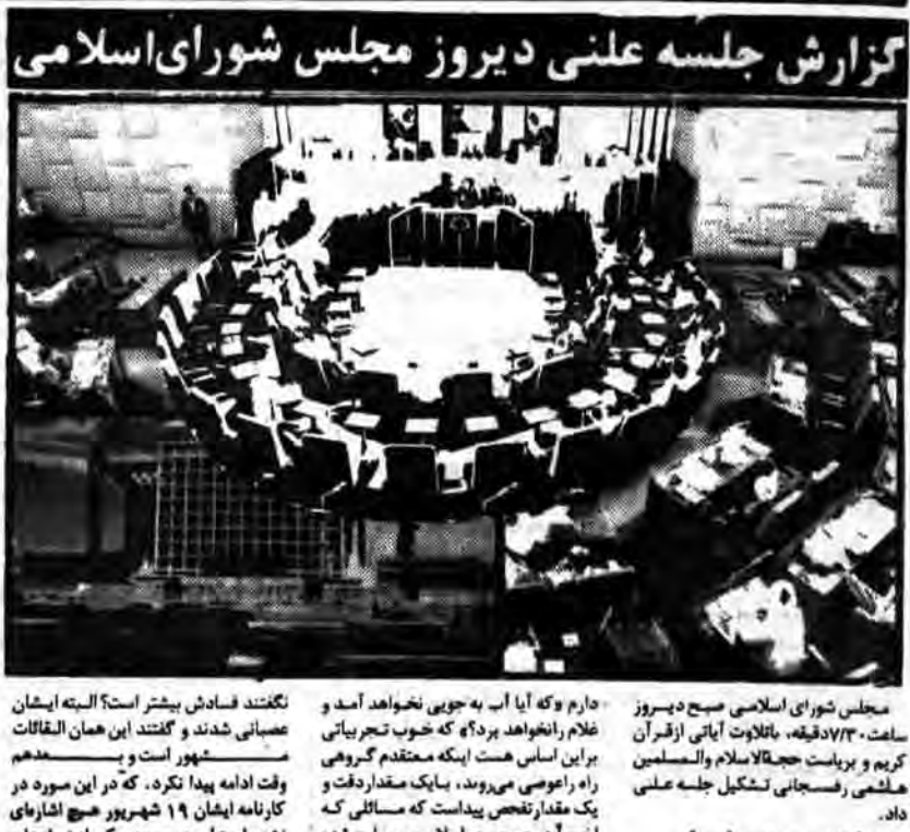
گزارش جلسه علنی دیروز مجلس شورای اسلامی