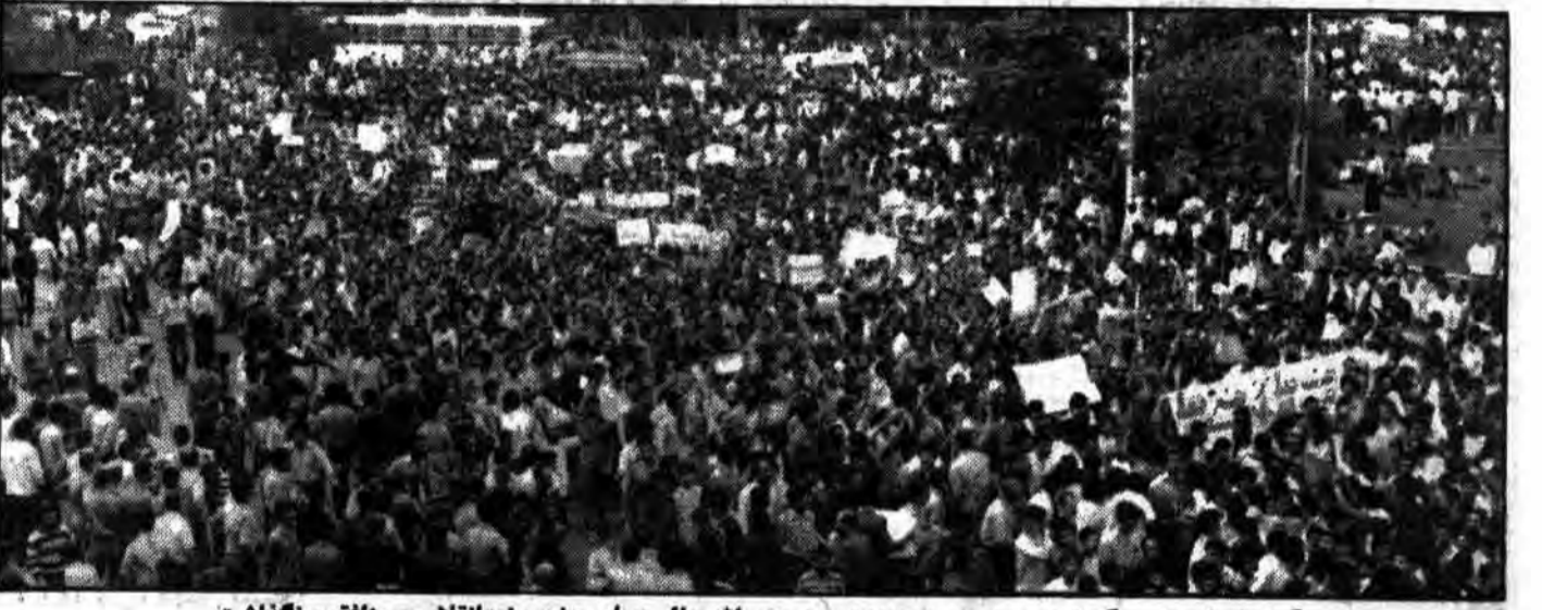
گوشای از حضور گسترده مردم در صحنه: دیروز حزب الله جانی برای حضور ضد انقلاب و منافقین نگذاشت

● آیت الله مهدوی کنی وزیر کشور: دفتر هماهنگی قانونی نیست ● امام گفته اند که دیکتاتور کیست، کسی که نه مجلس را قبول دارد و نه لایحه های آراء، نه شورای نگهبان و نه شورای عالی قضائی ● وقتی ما را بدآوری معرفی کردید، حالا اگر بر خلاف میل شما حرف زدیم نباید ما را رد کنید ● روحانیت و مردم مسلمان ایران بت شکن هستند و دیگر اجازه نخواهند داد که بت دیگری درست شود. ● اگر مسئولین کاری می کنند، مردم می دانند که قصد سانسور یا خفقان ندارند، چون آنها خودشان سالهای سال مبارزه کردند. در صفحه ۴