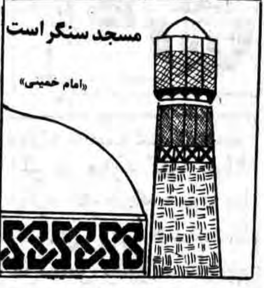
مسجد سنگر است امام خمینی