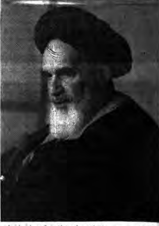
امام خمینی رهبر انقلاب و بنیانگذار جمهوری اسلامی ایران در روز دوم امتحان آفشار مختلف مردم سخنانی بشارت زیر ایراد فرمودند.