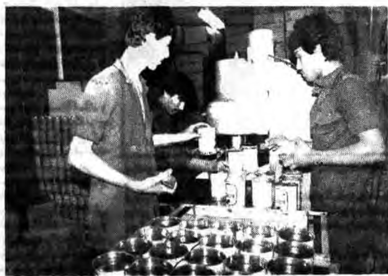
در این مرحله بر قطبهای یک لیتری خسته کس کارپل سرپوش گذاشته می شود تا برای بسته بندی آماده شوند.

در اجرای هدفهای انقلاب اسلامی ایران در جهت خودکفایی میهن اسلامی و بی نیازی ایران از کشورهای خارجی گانههای بلند و مؤثر و مقصدی بر دانشه است