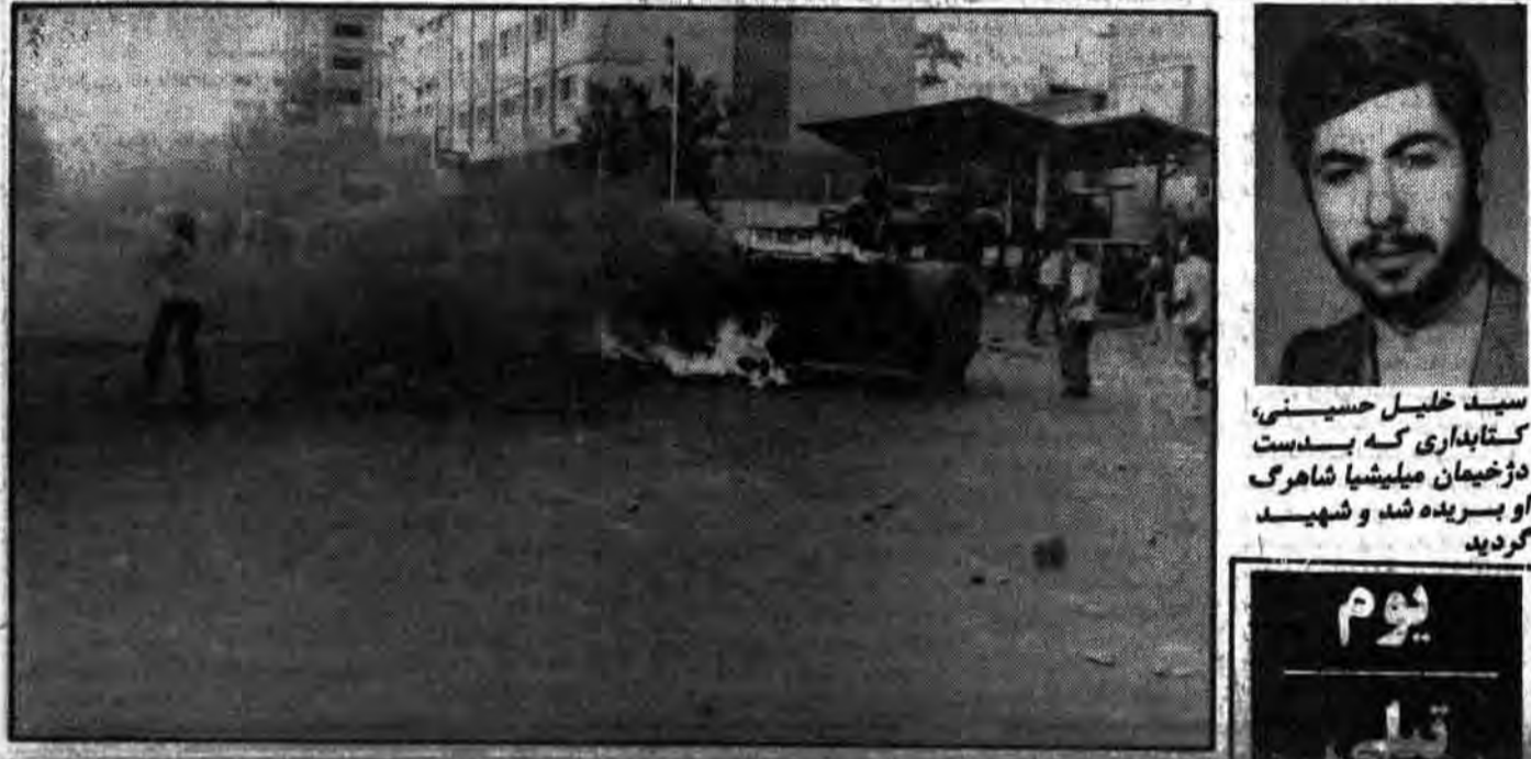
ماجراجویی منافقین خلق سودی بخاشان نخواهد بخشید

تقاضای روابط عمومی مجلس از مردم روابط عمومی مجلس شورای اسلامی طی اطلاعیه ای به خاطر کمبود جا و محدود بودن محوطه تالار جلسات مجلس از شهروندان محترم تقاضا کرد که افراد را سرچشمه به مجلس بنشانند تا شایسته خودداری انبوه و جریان ملاکات مجلس را از زبیرا مشاهده و این امر در هموار کردن امور مجلس به صورت مستقیم پخش میشود، استماع نمایند.