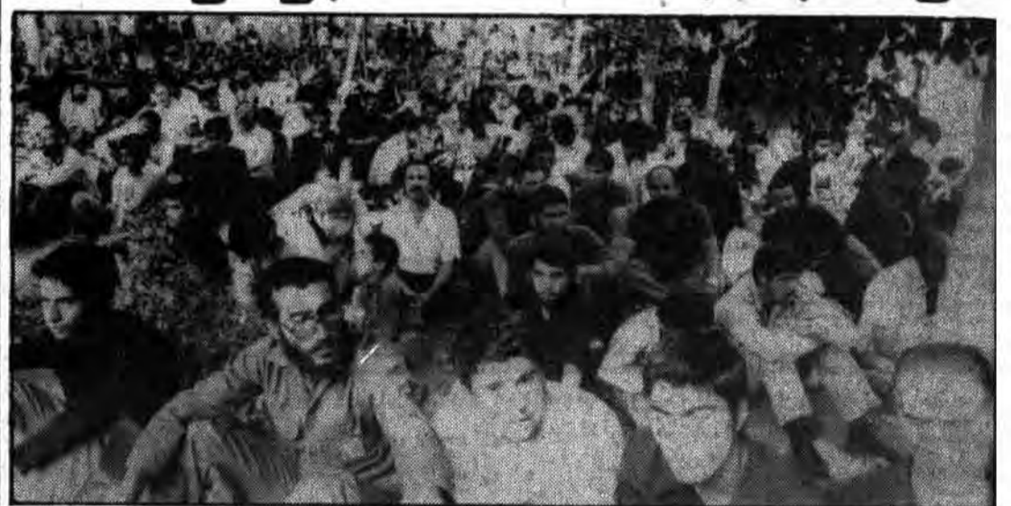
گوشه‌ای از اجتماع دیروز مردم در مسجد شهید مطهری

با حضور صدها هزار تن از امت شهید پرور و حضور نمایندگان و دولت