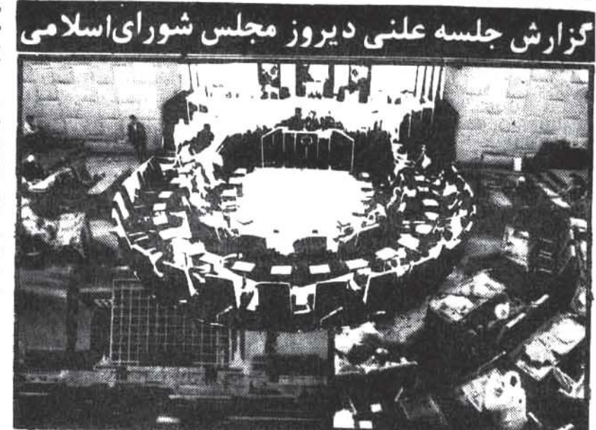
گزارش جلسه علنی دیروز مجلس شورای اسلامی