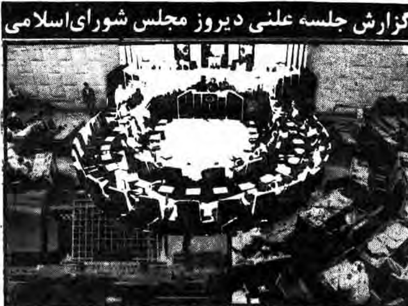
گزارش جلسه علنی دیروز مجلس شورای اسلامی