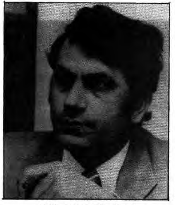
نعم خضر نماینده ساف در بلژیک

متمم شده اند بعضی معتقدند که این ترور بدون کمک سازمان های جاسوسی کشورهای عربی امکان پذیر نبوده است. لسنا وزارت خارجه بلژیک عملیات ترور را محکوم کرد. ونگرانی خود را نسبت به امکان گسترش این عملیات تروریستی ابراز داشت. دلیل دوم نشان میدهد عملیات تروریستی علیه فلسطینی ها پس از توقف دو ساله بار دیگر از سر گرفته شده است. چرا که در سال ۱۹۷۹ دو نماینده از نماینده های سازمان آزادیبخش فلسطین در خارج از بلژیک به این امر هیچگونه توجهی ننمود، زیرا او معتقد بود که محافظت از وی در اروپا باعث برانگیختن اعتراض مردم میشود زیرا که محافظت از شخصیتها در اروپا آن اندازه رواج ندارد که در خاورمیانه است. علاوه بر آن کشورهای غربی نسبت به گماردن محافظ برای حفظ جان نماینده های سازمان آزادیبخش فلسطین است. نعيم خضر هفتمین نماینده سازمان آزادیبخش فلسطین است که ظرف ۱۰ سال گذشته ترور میشود. ولی ترور او در پایتخت پیمان آتلانتیک چند معنی سیاسی در بر دارد.