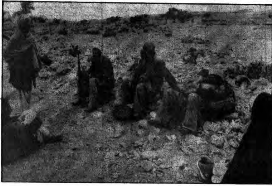
... و اما چه آسایشی