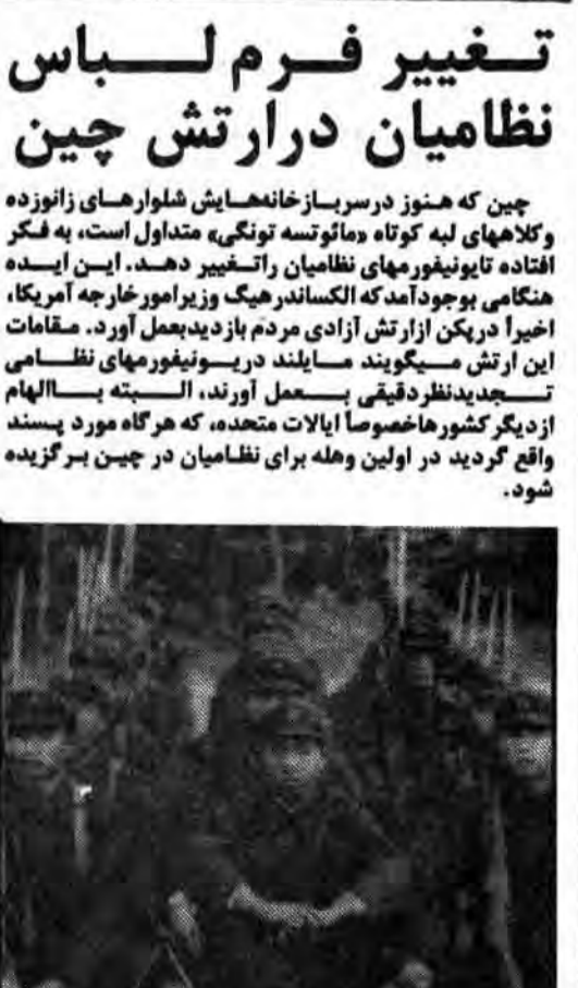
سربازان چینی با سلولارهای زانو زده و کلاه‌های لبه کوتاه موگوشه تونگی!

چین که هنوز در سرسازخانه‌های سلولارهای زانو زده و کلاه‌های لبه کوتاه «ماتوسه تونگی» متداول است، به فکر افتاده تا یونیفرم‌های نظامیان را تغییر دهد. این ایده هنگامی بوجود آمد که الکساندر هیک وزیر امور خارجه آمریکا، اخیراً در پکن از ارتش آزادی مردم بازدید بعمل آورد. مقامات این ارتش می‌گویند مایلند در یونیفرم‌های نظامی تجدیدنظر دقیقی بعمل آورند، البته به‌الهام از دیگر کشورها خصوصاً ایالات متحده، که هر گاه مورد پسند واقع گردید در اولین وهله برای نظامیان در چین برگزیده شود.