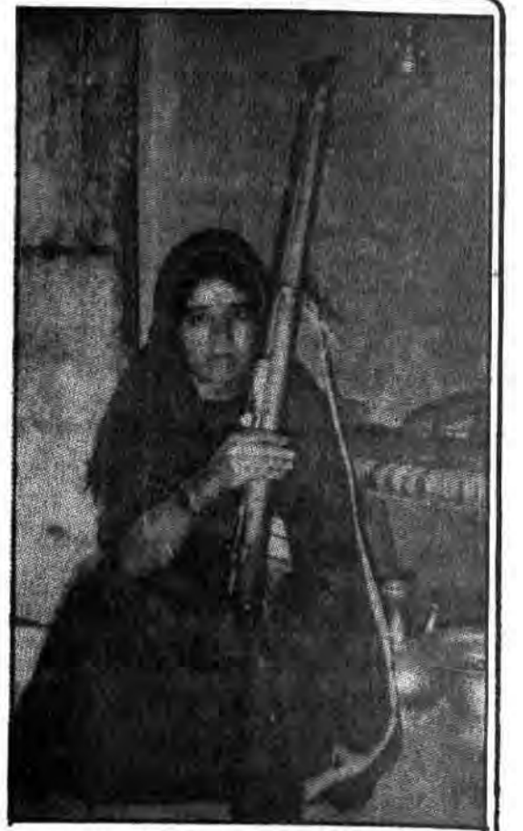
شیرزن افغان، هم خانه دار و هم پاسدار منزل!