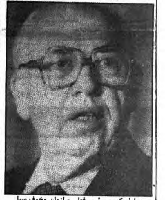
ویلیام کیسی رئیس فعلی سازمان مخوف سیا

در اقدامی که جهت کسب شهرت و آبرو برای سازمان جاسوسی سیایانجام می‌گیرد، کاخ سفید بارها، استعفا ۳ تن از اعضای سازمان را پذیرفت. دلیل این استعفا که از پیش طراحی شده است اشتباه کاری هیئت سازمان سیاه‌پوش، در ضمن بدنیست که بدنام بزرگترین اشتباه آنان انقلاب ایران لقب گرفته است. در ۱۹۷۷ توسط جیمی کارتر هیئت بوجود آمد بنام «هیئت ناظرین سازمان» برای سروری در کار سازمان و مطابق عملیات سیاه با قانون که تصفیه‌هایی را دنبال داشت، گروه ساموران عسارت بودند از فرماندار سابق پنسیلوانیا (ویلیام سکرانتون) سناتور پیشین (آلبرت گوور) ارتسی، که نیابت رئیس نیز داشت و وکیل واشنگتن (توماس ال فارمر) افسر پیشین سیا.