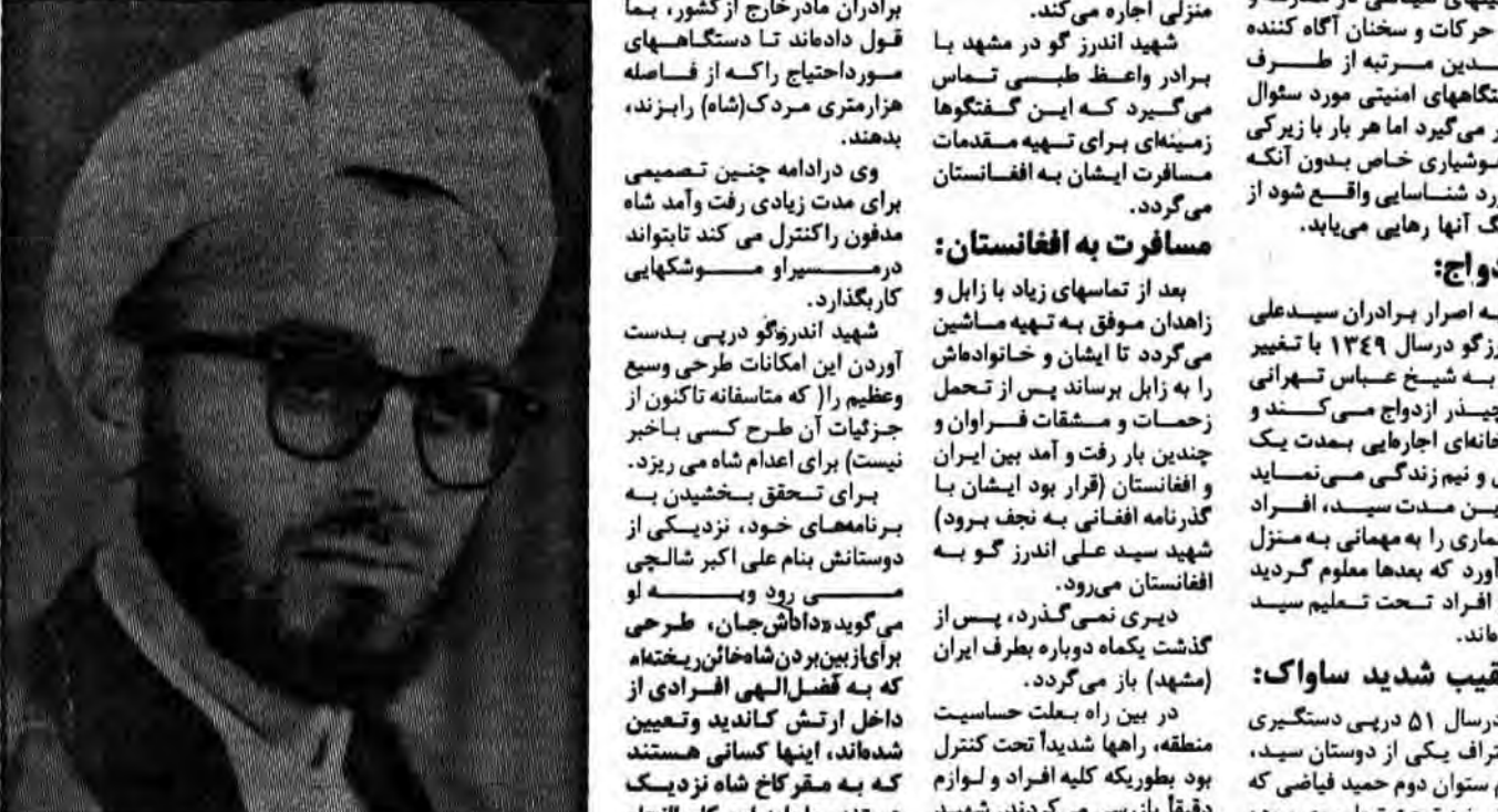
تصویر ۱۶ سالگی شهید سیدعلی اندرزگو

در این هنگام شهید اندرزگو در حال طرح نقشه‌ای دیگر برای از پا درآوردن شاه است که برای آخرین باری است که برای انجام ترور می‌بایست بطرفی این وسایل بگونه‌ای ساخته شده بودند که در مسافرت با سایر همسرهای رومی روی می‌سوار می‌شدند و آنگاه این مواد انفجاری را در آنها ریخته بودند تا در زمان احتیاج از آنها استفاده شود.