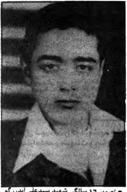
تصویر ۱۶ سالگی شهید سیدعلی اندرزگو

مراجعت به ایران: در سال ۱۳۴۵ به ایران مراجعت می‌کند و در قم به تحصیل می‌پردازد. اما دیری نمی‌گذرد که مورد شناسایی ساواک قرار می‌گیرد بناچار به تهران (شمیران) می‌آید و در مدرسه علمیه چیترا مشغول به فعالیت‌های سیاسی و درسی می‌شود.