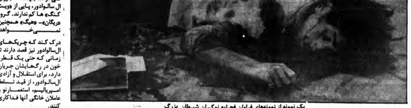
یک نمونه از نمونه‌های فراوان فجاج نوکران شیطان بزرگ

از مطبوعات خارجی از زمان صدور اعلامیه اخیر حکومت «رونالد ریگان» مبنی بر آن که این حکومت قصد دارد بکوشد به اصطلاح «اصلاحیه کلارک» را لسو کند، «یوناس ساویمی»، رئیس گروه «یونیتا» که در شمال نامیبیا مستقر است، باید مرد بسیار خوشبختی باشد.