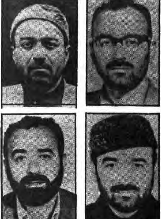
نمونه‌هایی از چهره‌های مختلف شهید سیدعلی اندرزگو

در این هنگام شهید اندرزگو در حال طرح نقشه‌ای دیگر برای از پا درآوردن شاه است که برای آخرین باری است که برای انجام ترور می‌بایست بطرفی این وسایل بگونه‌ای ساخته شده بودند که در مسافرت با سایر همسرهای رومی روی می‌سوار می‌شدند و آنگاه این مواد انفجاری را در آنها ریخته بودند تا در زمان احتیاج از آنها استفاده شود.