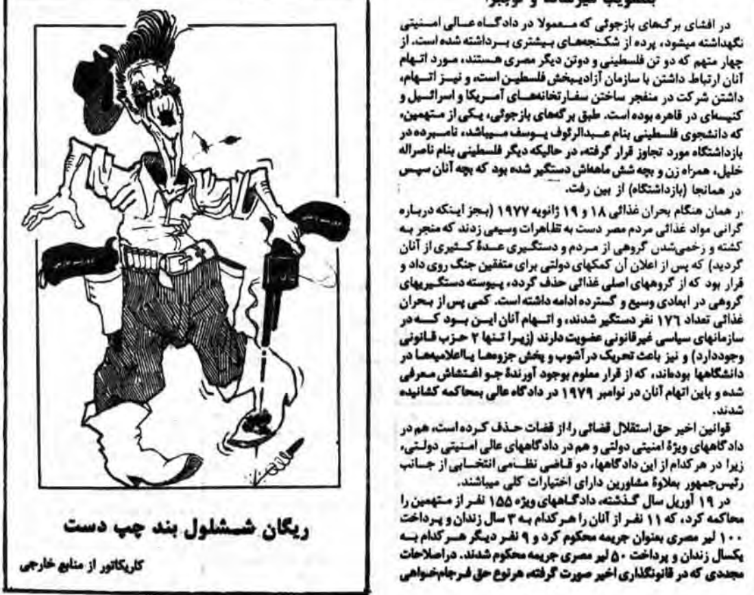
کاریکاتور از منابع خارجی