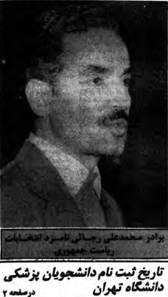
برادر محمدعلی رجایی نامزد انتخابات ریاست جمهوری

حضرات آیات عظام گلپایگانی، شیرازی و وحیدی مردم را بشرکت یکپارچه در انتخابات ریاست جمهوری و مجلس شورای اسلامی دعوت کردند در صفحه ۴