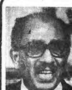
بهرت بود صدام حسین خبر...