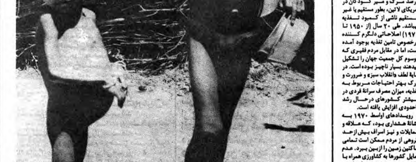
چنین سریع مردن فاجعه نیست...