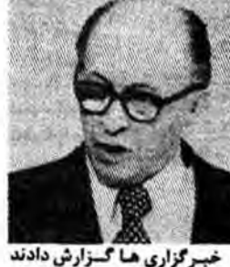
خبرگزاری فرانسه گزارش دادند...