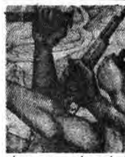
فلسطینی ها در سرزمین های اشغالی...