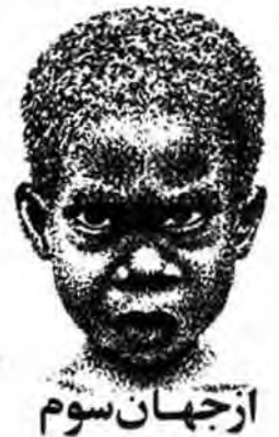
از جهان سوم