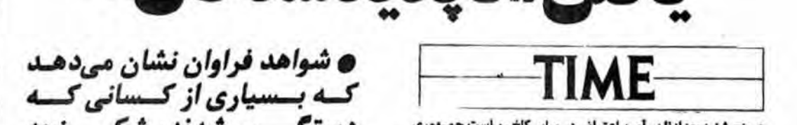
از: م - دست افکن

شواهد فراوان نشان می دهد که بسیاری از کسانی که شده اند، به قتل رسیده اند و اجسادشان در گورهای مخفی دفن شده است.