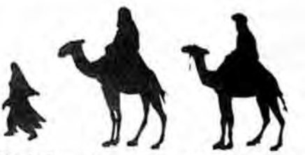
یکی از علل نیاز کشورهای خارجی اینست که این کشورها از منطقه خاورمیانه به کشورهای خیرات و مواد طبیعی خودآبادی