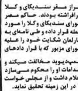
افزاد مسفر سندیکای و کلا...