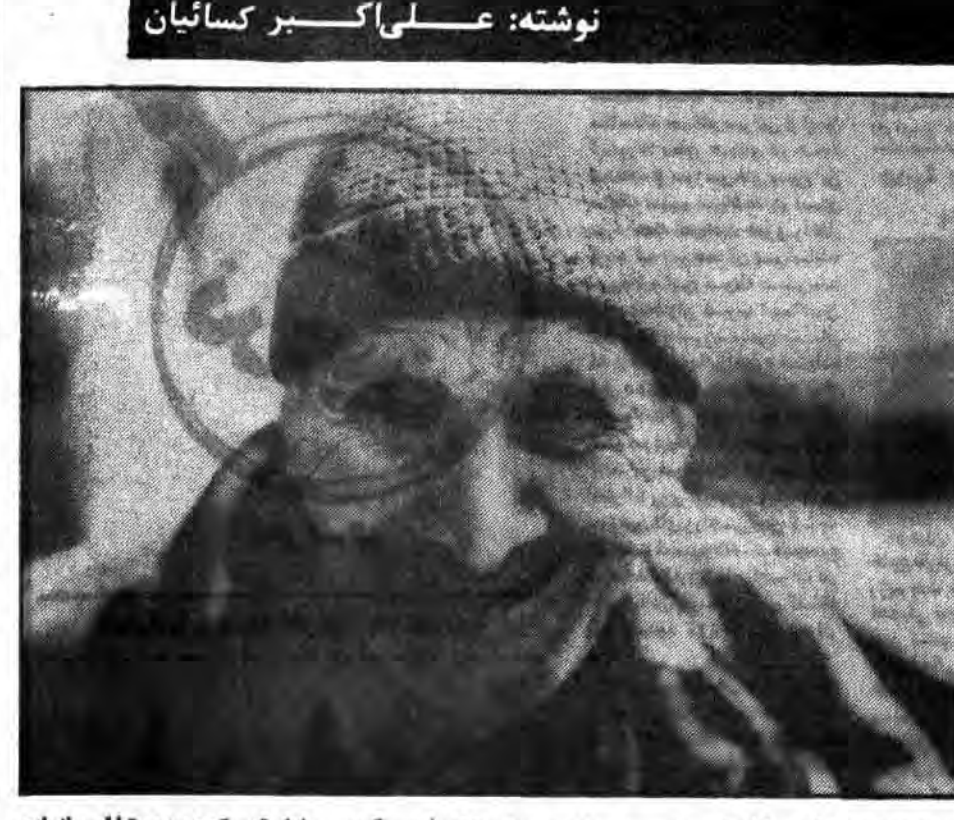
نوشت: علی اکبر کسانیان

همراه من بیاید تا آنرا نشان بدهم، وارد کوچه باغی شدیم که حمام قبلی ده را ببینیم تا اینکه معلم در قطعی ایستاد و گفت: بیایند ما به کوزیر بیایند تا بنوعی شونه که در عرض دوسال در این روستا پرت افتاده و دور چگونه یک مدرسه، یک حمام بهداشتی و یک مسجد بزرگ