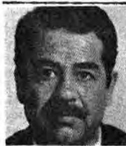
در میان کشورهای عربی حوزه خلیج فارس که کمک شایانی به رژیم صدام کرده اند...