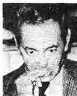
شهردار البیضاء در مراکش و...