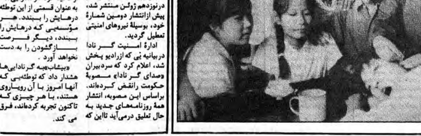
توطئه «سیا» برای سرنگونی حکومت گرانادا

«تمدن اخلاقی» یک کلمه رمزی جدید برای رفتار درست است. احتمال نمی رود که اداي سوگند، به سربازان چینی الهام بخشد، سربازانی که خاطرات آنها هنوز از هزیمت در ویتنام که دو سال پیش روی داده، زنده است. اکنون آنها احساس می کنند که در اثر سیاستهای جدید کشاورزی بیشتر زیر فشار قرار گرفته اند. سیاستهایی که مشکلات مالی برای خانواده های آنها به وجود می آورد. آنها همچنین از کاهش فرصت خودشان برای مأموریت مطلوب در شهرها، احساس قربانی شدگی بیشتری می کنند ماه دسامبر گذشته شمری در نشریه «فرانتیر لیتیر پچر اندارت» منتشر شد که در آن، از دست رفتن روحیه یک سرباز چینی بیان شده است. روزنامه روشنفکرانه «ون هوی یائو» چاپ شانگهای، این شعر را محکوم کرد و این پیش بینی کردنی بود.