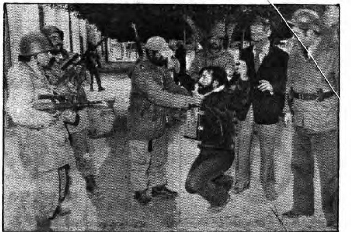
یک دانشجوی تونس توسط پلیس دستگیر شده است

هم اکنون در تونس یک حرکت اسلامی عظیم جریان دارد که مقامات این کشور را بشدت نگران کرده است. دانشجویمان و دانش آموزان تونس هم بزگی در این حرکت ایفا میکنند در دوم مارس سال جاری تظاهراتی در شهرهای مختلف تونس آغاز گردید و تا دو هفته ادامه یافت. در این تظاهرات بیش از ۱۵ هزار نفر شرکت کردند.