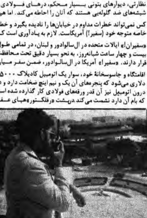
محمک کردن «سفارت» یادامه دارد. در تراس میان طبقات، «سفارت» تنفنگداران دریایی آمریکا کوسه‌های شن کار گذارده‌اند تا اگر نیاز باشد، کارکنان سفارت بتوانند در پناه آن پنهان شوند.

کارکنان جاسوسخانه ایالات متحده در ال سالوادور، ناگزیرند برای چیزی آماده شوند که بسیار جندی‌تر از جنگ و گریز چریک‌هاست. همیشه این امکان وجود دارد که جمعیت انقلابیون به «سفارت» حمله کند و ساختمان را تصرف کند و کارکنان جاسوسخانه را گروگان بگیرد یا بکشد و پرونده‌های حساس را ضبط کند. از زمان تصرف جاسوسخانه ایالات متحده در تهران، جاسوسخانه آمریکا در سان سالوادور (همچاه با «سفارت» های آمریکا در ده دوازده پایتخت دیگر جهان) مواضع دفاعی خود را تقویت کرده است. نخستین مانعی که مهاجمان انقلابی موفق بوده به «سفارت» با آن مواجه خواهند شد، سدهایی از گزازه‌های استکاور است. ۵۰ طرف محوی گاز اشک‌آور در اطراف خارج ساختمان وجود دارد که می‌توان آنها را از یک متر فرماندهی تنفنگدار دریایی که در راهرو قرار دارد به نحو همزمان یا به نحو انتخابی «شلیک» کرد. پس از آن، هر مهاجمی ناگزیر خواهد بود یک در شیشه‌ای ضد گلوله که پشت آن فولاد کار گذارده شده است شکنند تا وارد ساختمان شود. همچنین پس از آن، آنها با سوزن‌هایی از درهای فولادی در هر طبقه ساختمان مواجه خواهند شد.