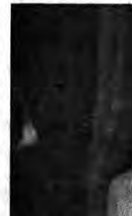
بچه‌ها در انتظار غذا هستند

نکیرید زیرا او در این بیابان خشک، تنها میخوابد که زنده بماند.