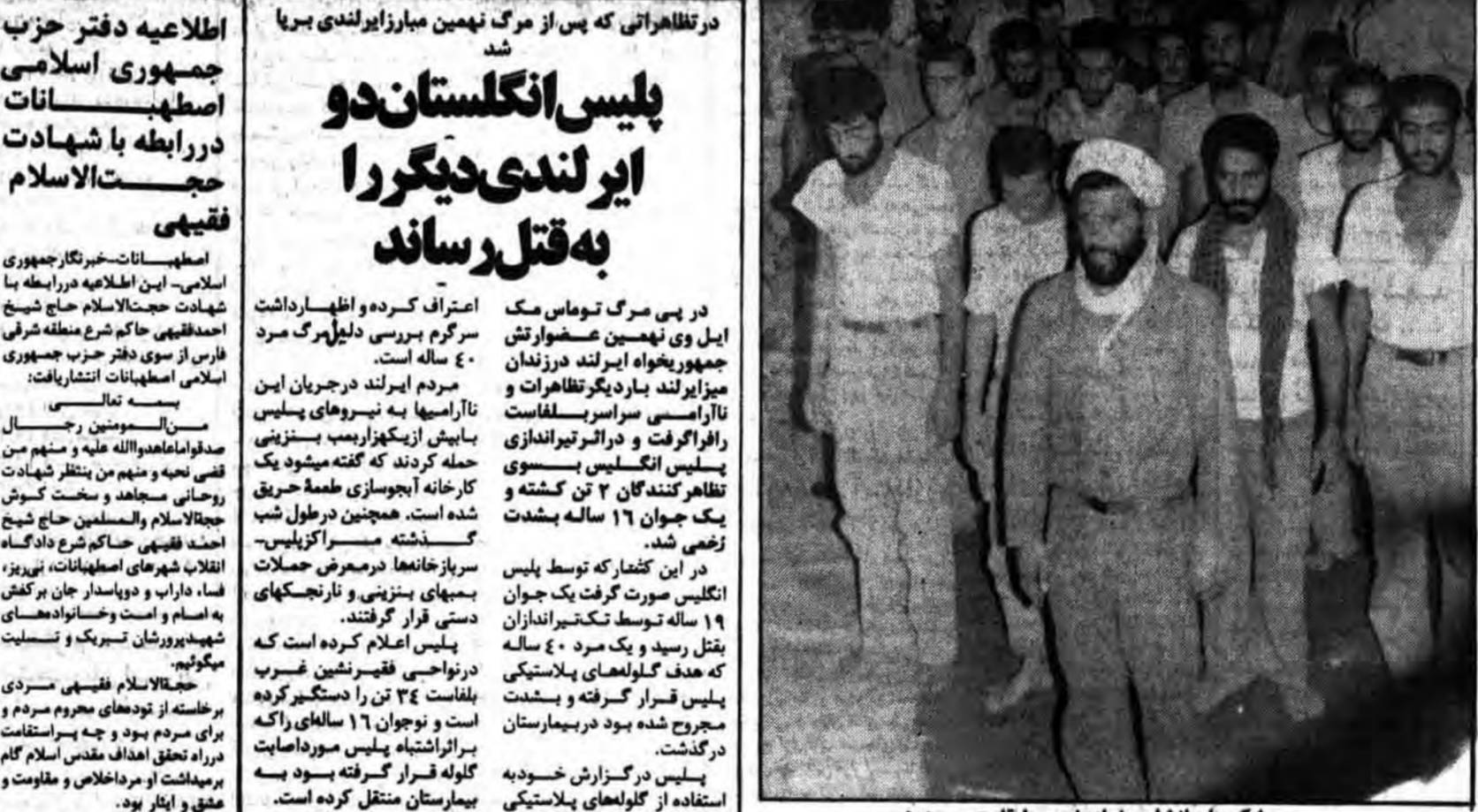
.... و بر شکوه ایمانشان، نماز خون را قامت می بندند.

با ۱۵۰ کشته و ۱۲۵ اسیر: مأموران امنیتی صدام تظاهر کنندگان شهر سلیمانیه را به رگبار گلوله بسته و ۲۰ تن آنان را به شهادت رساندند. ۶ تانک و خودروی متجاوزین در دشت عباس و عین خوش منهدم شد. ۱۳ تن از مدافعان انقلاب اسلامی در جبهه دار خوین به شهادت رسیدند. ۲ افسر فرمانده گردان ارتش صدام در این عملیات به هلاکت رسیدند.