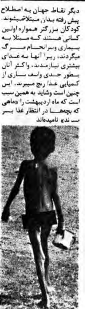
بچه‌ها در انتظار غذا هستند

در زبان مردمان شرقی اوگاندا (ایتوس) همانگونه که در پیش رفته بدان، مبتلا میشوند. کودکان بزرگتر همواره اولین کسانی هستند که متلاسه بیماری و سرانجام مرگ میگردند، زیرا آنها به غذای بیشتری نیازمندند، و اکثر آنان بطور جدی و اسفناکی از کمبود غذا رنج میبرند. این کمبود غذا در سراسر جهان است که ماه‌ها در انتظار غذا بسر می‌نمایند.