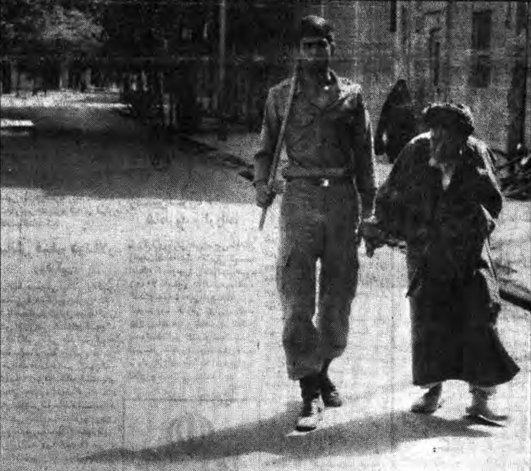
سرباز اسلام عصای دست روحانی خستگی ناپذیری که از ابتدای جنگ عراق علیه ایران از زادگاهش آبادان بیرون رفته است. او با صدائی لوزان خطاب به زرمنده اسلام می‌گوید، فرزندم تا شما جوانان مسلمان و رشید در اینجا هستید من هم می‌مانم و با شما دفاع می‌کنم