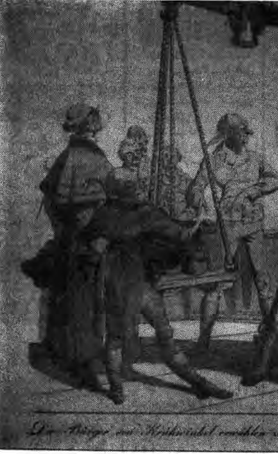
Die Menge im Reichstag verhalten zu dem Präsidenten Mann von Gendel

رئیس یک کمپانی فرانسوی انجام و گسترش نامحدود تجارت و ماکله را در خاورمیانه اینچنین تشریح کرد. مقامات مجازت فرانسوی کاملاً خوب میدانند که بدون پرداخت رشوه معامله در این کشورها غیر ممکن است. هم‌چنین اوضاع کشورهای صادر کننده بزرگ آسیائی این چنین میباشد در ژاپن پرداخت رشوه به مقامات خارجی برای «امتیاز معاملات» چیزی است که خیلی عادی تلقی میگردد و شبه آن در کره، حکومت چینی را اتخاذ میکنند که بازرگانان در کوشش‌هایشان برای گسترش صادرات و بازارها و دست یابی به پیمانهای دیگر کشورها باید، بخشند و دست به جیب باشند موجودیت فساد و رشوه انکار ناپذیر است و باوضع کنونی جهان مسلماً خواهد بود آیا آمریکا هم قاعدتاً میباشد در آن سهم گردد؟ رشوه‌خواری در ابعاد هائی که اکنون هست با ارزش و سودآور است، اما ضرورت‌های سیاسی را فاسد و میتواند سرانجام اعتماد مردم را از حکومتها سست کند و رژیم شاه ایران ساززاد آنتاسیوسوزا در تیکارگواشاهدان این موضوع میباشد.