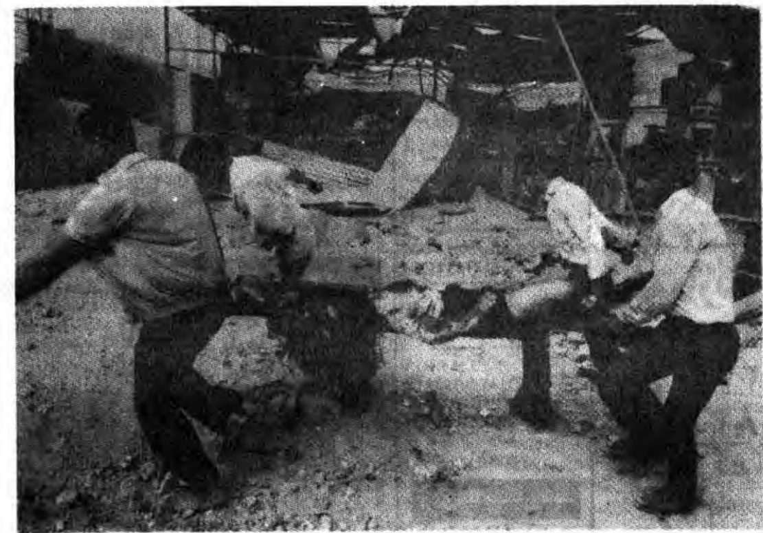
مردم موجود خواهد آورد. رژیم نژادپرست صهیونیست با بمباران راکتور هسته‌یی، نوع جدیدی از تروریسم بین‌المللی، و ریس، یعنی تروریسم هسته‌یی را تأیید کرده است.

بودن فلسطین اشغال شده به زبان صهیونیست‌ها فاش شود؟ نه، مسلماً چنین نیست. تبلیغ مطبوعات درباره مسیزان سلاح‌های اتمی اسرائیل برای آن است که به جهان عرب فشارهای روانی وارد شود و آنها را به تجدید نظر در سیاست‌های خود در برابر رژیم اشغالگر قدس وادارد. خود حکومت‌های اسرائیلی، مصرا نه انکار کرده‌اند که رژیم صهیونیستی جنگ افزارهای هسته‌یی در اختیار دارد. اما «موشه‌دایان»، وزیر دفاع پیشین اسرائیل، اعتراف کرد که رژیم فلسطین اشغال شده «نیروی لازم برای تولید جنگ افزارهای هسته‌یی را دارد و اگر اعراب هم چنین کاری را بکنند، اسرائیل در آینده نزدیک امکان تولید بمب‌های اتمی را به دست خواهد آورد.» رژیم نژادپرست صهیونیست با بمباران راکتور هسته‌یی، نوع جدیدی از تروریسم بین‌المللی، و ریس، یعنی تروریسم هسته‌یی را تأیید کرده است.