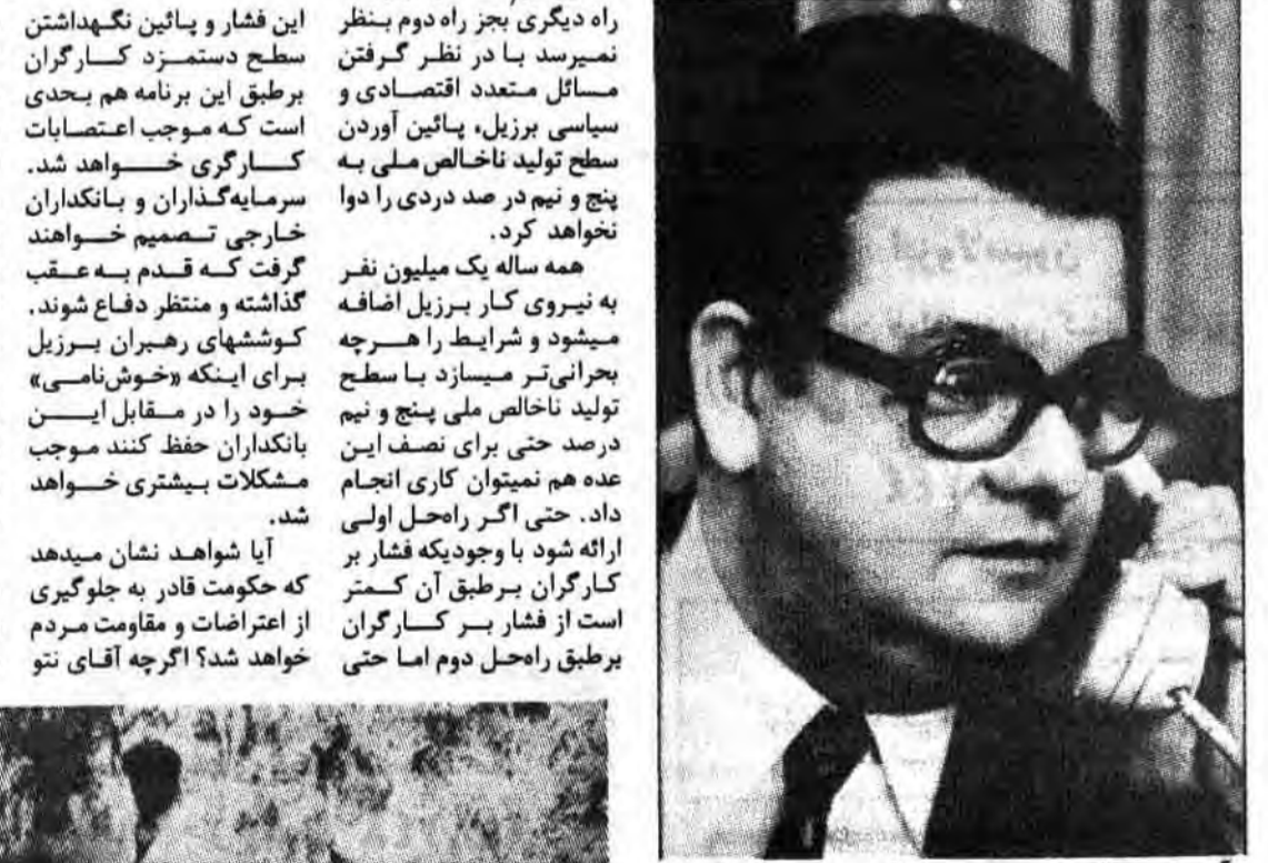
آنتونیو دلفیم - وزیر برنامه ریزی و معر اقتصادی برزیل

که مغز اقتصادی برزیل آقای آنتونیو دلفیم نم باید کار کند. او که در اواخر سالهای شصت معروفیت جهانی یافت باید اقتصادی را که تورم در آن نود درصد است، کسری بودجه سه و نیم میلیارد دلار است و اقتصادی را که تمام درآمد کشور بساید صرف پرداخت قیمت نفت و اقساط کالاهای وارداتی سود سروسامان بختی دو پیش بینی این شرایط موجب گشته است که افراد سیاسی و اقتصاددانان کشور بشدت از