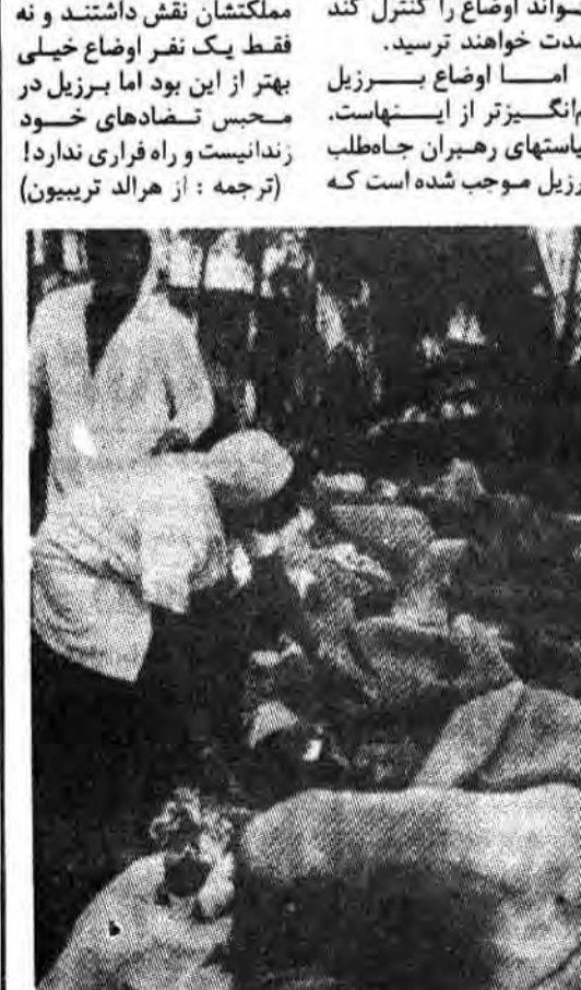
بیماری و مرگ و میر در برزیل، مسئله‌ای که ۱۷ سال مداوم مردم با آن دست به گریبانند

این فشار و پائین نگهداشتن سطح دستمزد کارگران بر طبق این برنامه هم بحدی است که موجب اعتصابات کاری خواهد شد. سرمایه‌گذاران و بانکداران گرفت که قدم به عقب گذاشته و منتظر دفاع شوند. کوششهای رهبران برزیل برای اینکه «خوش‌نامی» خود را در مقابل این بانکداران حفظ کنند موجب مشکلات بیشتری خواهد شد. آیا شواهد نشان میدهد که حکومت قادر به جلوگیری از اعتراضات و مقاومت مردم خواهد شد؟ اگرچه آقای نتو