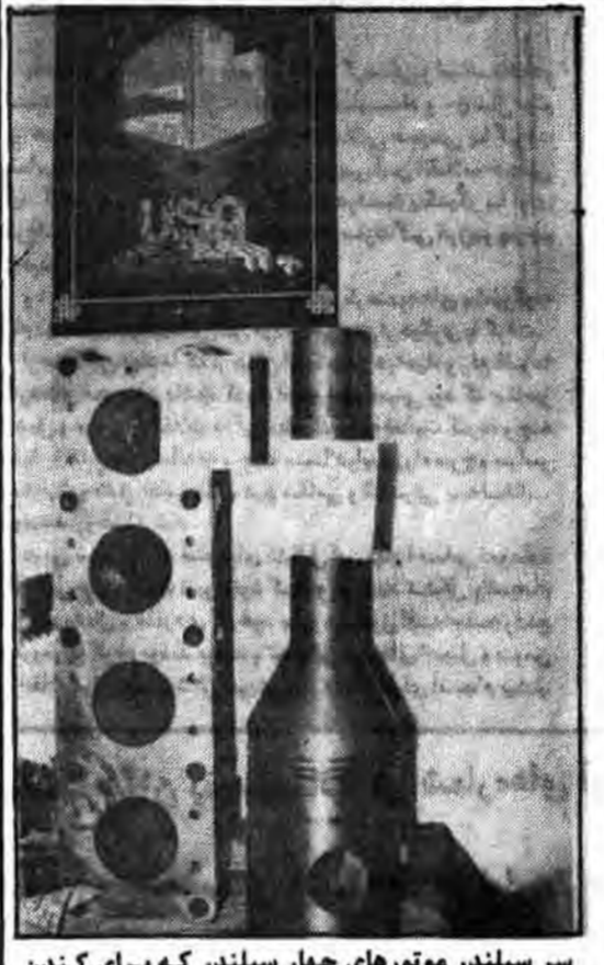
سر سیدمحمد مونتواهی چهار سیدلند که برای کندن سنگ از کوه و معادن بکار میروند، همچنین پیستون فشار قوی و ضعیف کمپرسور که بوسیله صنعتگران اصفهان ریختهگری و تراشیده شده است.