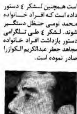
موج ناراضی در ارتش عراق

روزنامه تایمز در مورد عقب‌نشینی عراق نوشته است، صدام تکریتی در یک کنفرانس مطبوعاتی گفت علیرغم اینکه ارتش عراق علاقه‌ای به عقب‌نشینی ندارد، بلکه معتقد است باید ارتش چند کیلومتر از برخی مناطق عقب‌نشینی نماید. این روزنامه افزود عراق تا بحال ده هزار کشته