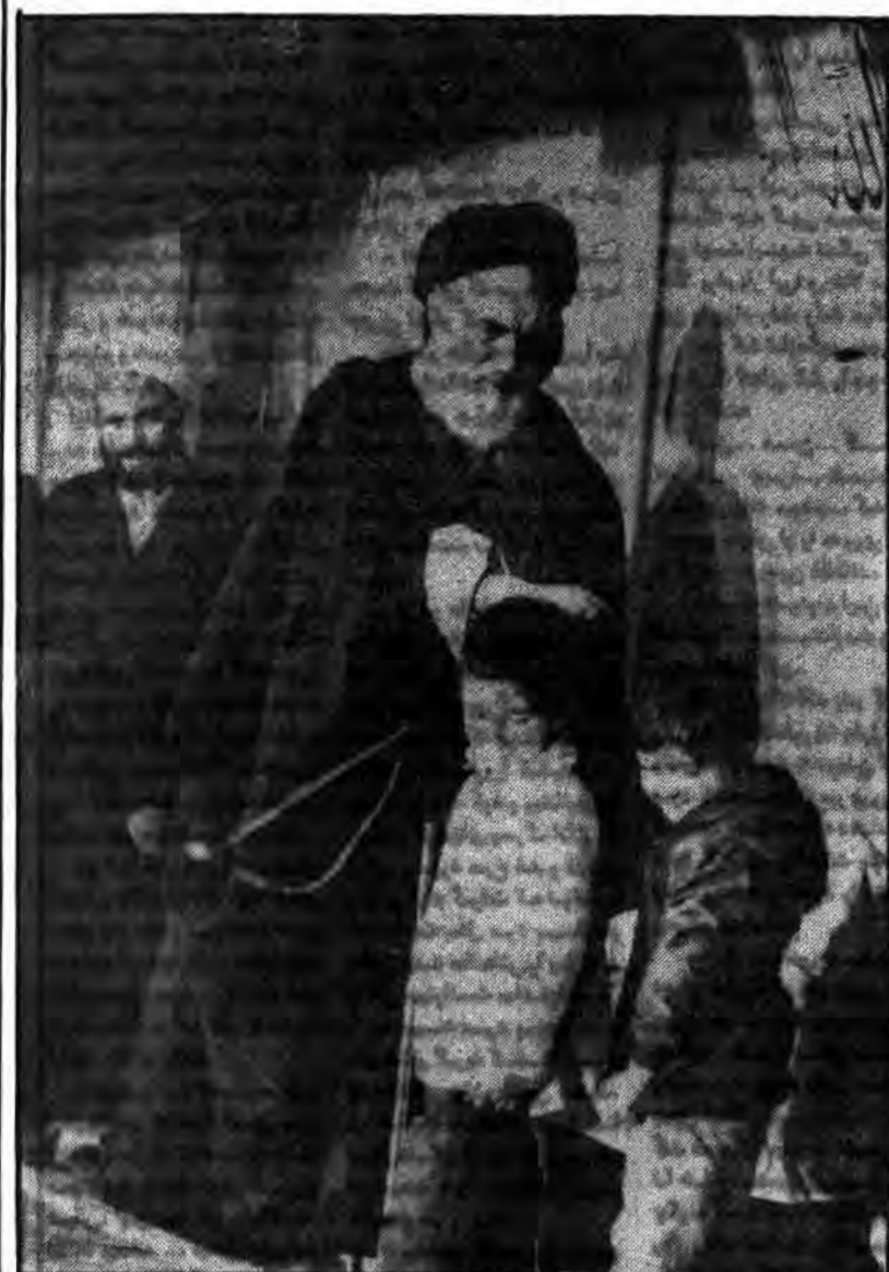
عکس مهدی که رفته پیش آقا و امام دست گذاشته روی سرش