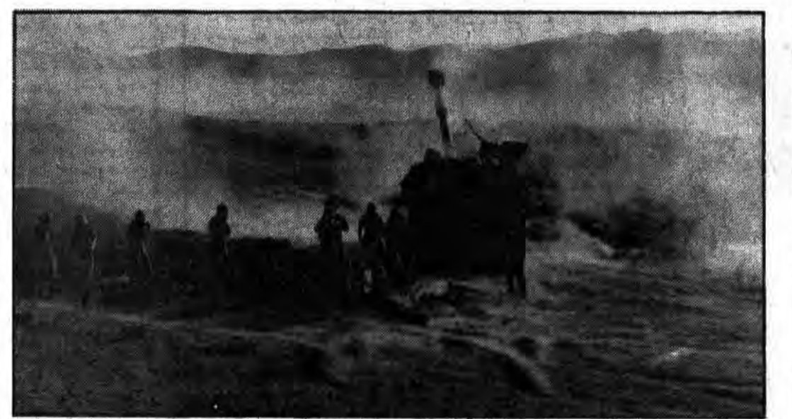
مواقع نیروهای اشغالگر صدام لطمه‌ای از آتش دشمن سوز آتش اسلام در امان نبوده و قوای پرتوان اسلام با حملات بی‌دریغی خود خیالهای خام سران این کافران را به یاس تبدیل می‌کند

بسم الله الرحمن الرحيم به مناسبت انتخاب جناب آقای محمد علی رجائی ریاست محترم جمهور مبنی اسلامی و کشور عزیزمان تلگرافات و نامه‌های تبریک بسیاری از سوی شخصیتها محترم روحانی و مملکتی و نهادهای انقلابی و گروهها و سازمانهای دیگر به دفتر واصل و به اطلاع حضرت امام خمینی مدظله العالی رسید و امر فرمودند بدین وسیله ضمن اظهار تشکر از عموم آنان از اینکه نمی‌توانیم جداگانه به هر یک پاسخ دهیم مطرقت خیراتنه سلامت و توفیق همگان را در عمل به وظایف اسلامی و قانونی از خدای تعالی مسئلت داریم. دفتر امام خمینی وام اجرایی ساختمان می‌دهیم خانه‌سازی - نیمه تمام ۸۵۸۵۷۴