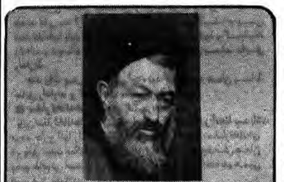
گناه شهید بهشتی این بود که پاک، شمشیر، شمشیران قوی و برای تداوم انقلاب سرمایه عظیم فکری بود.

است پس و در حال شدن می گفت: با آنها که از اسلام فاصله گرفتند مدارا کنید و با آنها سخن بگوئید و امید داشته باشید که به مرور زمان و کسب آگاهی نسبت به اسلام این فاصله برداشته شود و آنها هم به شما پیوندند. می گفت اصل جذب نذرگه ای باشد برای هر کسی که اهل صلح و ایمنی و مسالمت است. کتید. نه تنها با گفتار و خود به اینها همه پای بند بود و عمل میکرد. و بهشتی از خود خواهی به دور بود. از خود پرستی بدور بود. قدرت طلبی بدور بود. با سلطه جوئی در سبزه بود. او حق جو بود. بویایی حقیقت بود. خوبی نیکی او زبانه زد همه کسانی بود که او را از نزدیک دیده بودند. او خدا را بر خود ترجیح میداد و مصالح خلق خدا را بر مصالح خویش میس میس