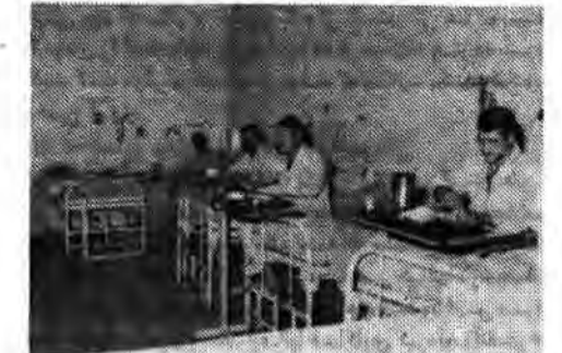
بیمارستان شهربانی با امکانات کامل رفاهی