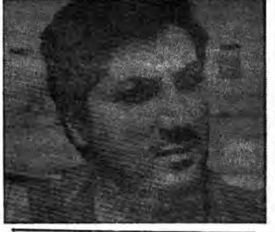
از: اللواء، چاپ بیروت

روزنامه والنداه چاپ بیروت در شماره ۲۴ اوت خود نوشت که کتابی‌ها اخیراً ۱۴ وسیله زمینی از صهیونیست‌ها دریافت کردند که از جمله چند زرهوش به چشم می‌خورد. از سوی دیگر انعام رعد رئیس حزب سوری قومی اجتماعی تاکید کرد که اظهارات بشیر جمیل در واشنگتن و ادامه آنکا به منافع تسلیحاتی صهیونیستی دلجلی است بر تطبیق نقشه‌های صهیونیستی و امریکائی در مورد منطقه و ایجاد کمیدویید تازه‌ای در خاک لبنان.