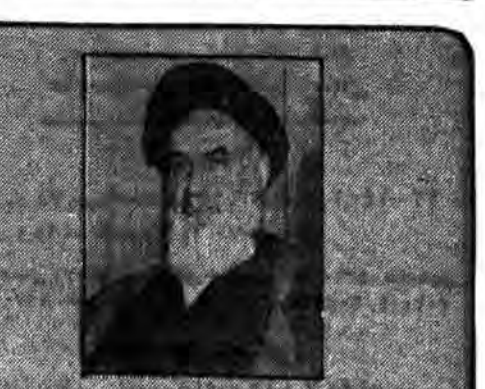
۷۳ شهید (۷۳) که امام به وابراره بودنشان شهادت داده است، تنی چند از وابراره زمان ما بودند که و اشرار و تاب تحمل پاک و فضیلت و حقگرای و خداجوئی آنها را نداشتند.

او به سفری جاودانه میروند. آن شب ستارها شهادت دادند که اینها از وابراره اند. و اماشامان نیز فریاد آن شب این چنین شهادت داد: اشخاصی بودند که تقدیری که من از آنها می شناسم از ایرار بودند. آن اشخاصی متعهد بودند که در راه آنها مرحوم بهشتی است. راستی بهشتی چه گناهی داشت؟ آنها که از لحظه پیروزی انقلاب تا لحظه شهادت بهشتی دانسته یا ندانسته او را آماج تهمت های خود قرار داده بودند چه گناهی از او سراغ داشتند؟ می دانید گناه او چه بود؟ او همان گناه بزرگی را مرتکب شده بود که اماش علی (ع) و امام دیگرش حسن (ع) و امام دیگرش حسین (ع) و همه اماشان مرتکب شده بودند. گناه دفاع از اسلام. همان گناهی که شیخ فضل الله نوری را به در آویخت. بهشتی حتی یک لحظه از عمر خود را به بطالت نمی گذراند. او میخواست از لحظه لحظه عمر خود برای سربلایی حکومت اسلامی بهره برداری کند او خود را وقف اسلام کرده بود. دشمنان اسلام از گناهی او یا به دشمنی به گناه بهشتی این بود که پاک بود. متعهد بود. به اسلام متعهد بود. سراسر نظام جمهوری اسلامی یک پشتیبان قوی بود. برای تداوم انقلاب اسلامی سرمایه عظیم فکری بود. فلسفان سراسر محرومان و مستضعفان میسید. آسانها را دوست داشت. می گفت انسان موجودی ولسی اسلام قاضی را یا نسبی