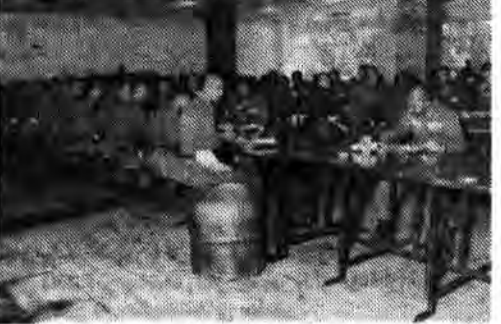
دانشجویان و دانش آموزان دانشگاه پلیس هنگام صرف غذا

شهربانی جمهوری اسلامی ایران (دانشگاه پلیس) برای تکمیل کادر پرسنلی خود از همپیمان عزیز واجد شرایط و علاقمند بحرفه مقدس پلیسی دعوت به همکاری نموده و تعدادی را از طریق انجام مصاحبه و آزمون کتبی استخدام مینماید. پذیرفته شدگان پس از طی دوره آموزشی با درجه پاسبان سومی در تهران و یا شهرستانها بخدمت گمارده خواهند شد.