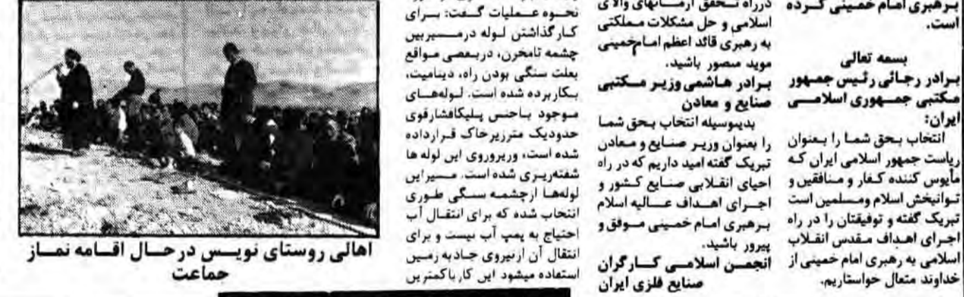
اهالی روستای نویسن در حال اقامه نماز جماعت