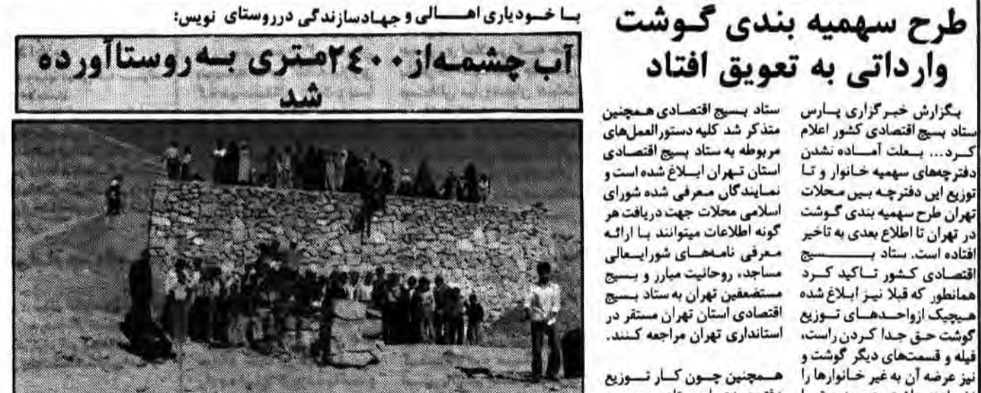
معاون آب سنجی که توسط جهادسازندگی و با کمک اهالی روستای ساخته شده است.