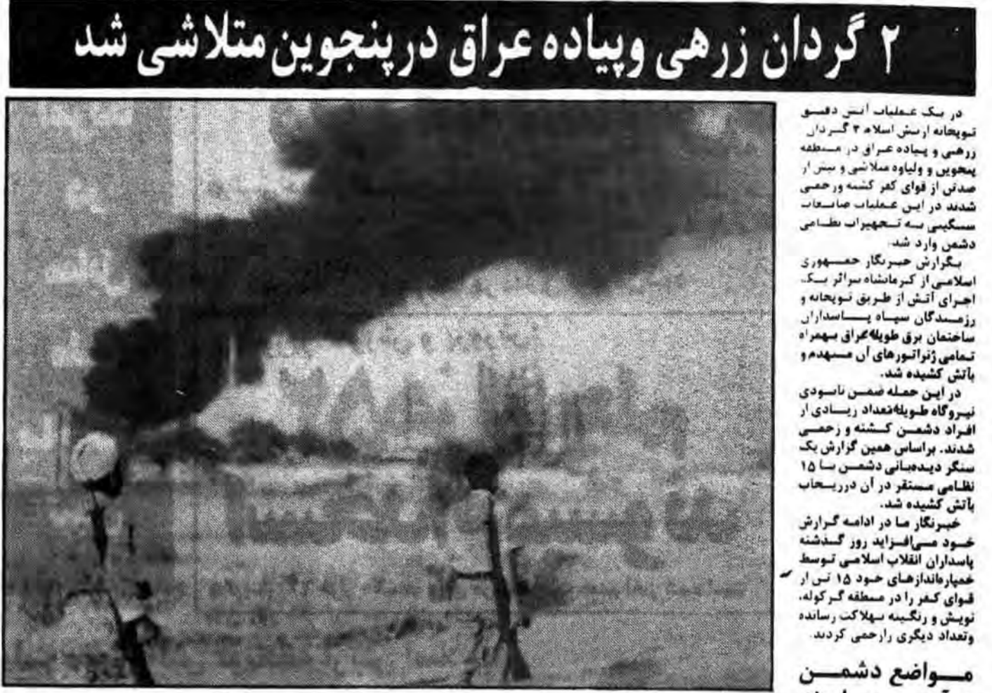
در یک عملیات آتش توپخانه ارتش اسلام ۳ گردان زرهی و پیاده عراق در منطقه ملامشی و سوسنگی به این عملیات نظامی دوشم شرکت کردند.

در این حمله ضمن ناسودی نیروگاه طویلمدت ریسادی از افراد دشمن کشته و زخمی شدند. ارتش اسلام در پی کشتن سبک سینه دشمنان ۱۵ نفر نظامی دشمن در آن در ریاضات باقی گذاشته شد.