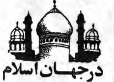
در جهان اسلام