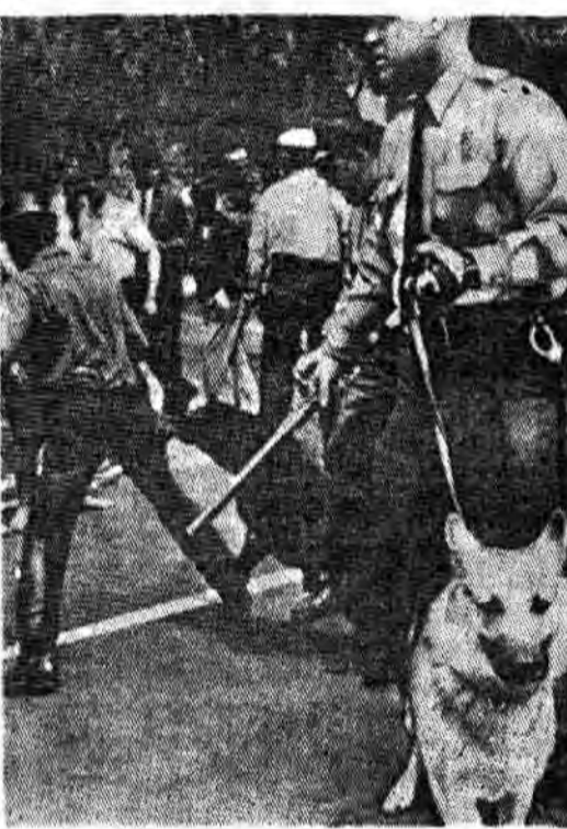
سگ سگاست چه سگ نیروی دریایی، چه سگ پلیس