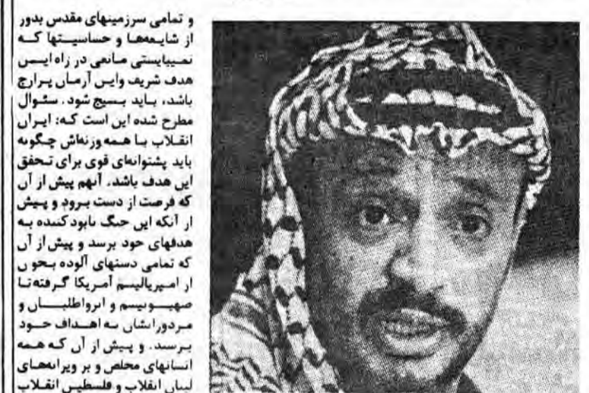
گذاشتناست. خلق فلسطین برعم

شروط آرا گوئی در این و آن کشور و در زیر سلطه این و آن رژیم، از شصت سال پیش توستاست ارزشها و اصول خویش را با خون غسل دهد تا اینکه بصورت خلقی شهید درآمد و با بصورت خلقی که چشمه برای حروج از حس دوخته است: پیروزی یا