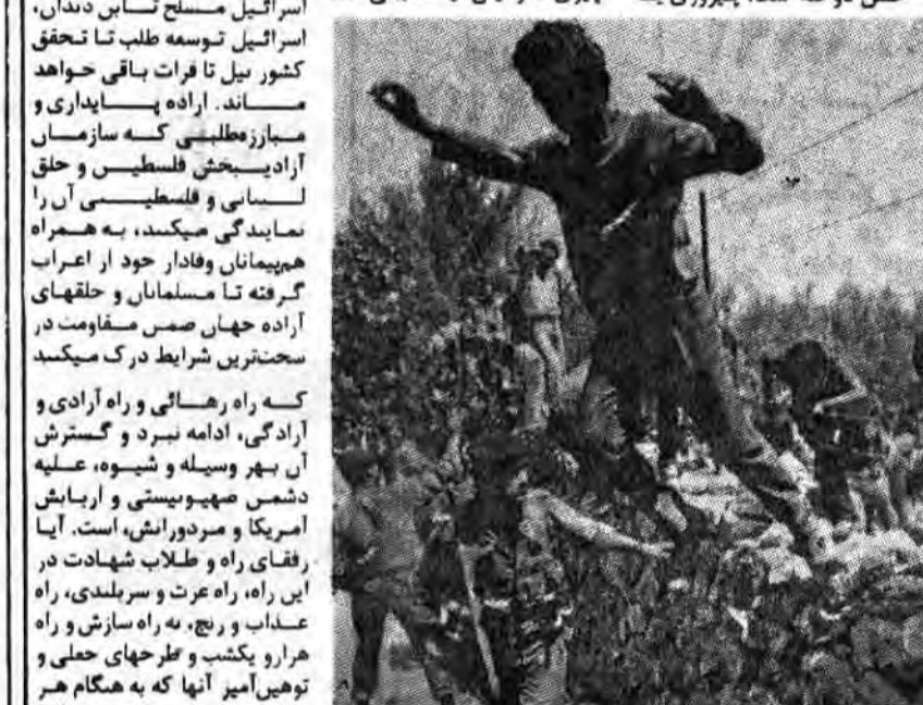
شهادت. خلق فلسطین مشتاق آزادی

شروط آرا گوئی در این و آن کشور و در زیر سلطه این و آن رژیم، از شصت سال پیش توستاست ارزشها و اصول خویش را با خون غسل دهد تا اینکه بصورت خلقی شهید درآمد و با بصورت خلقی که چشمه برای حروج از حس دوخته است: پیروزی یا