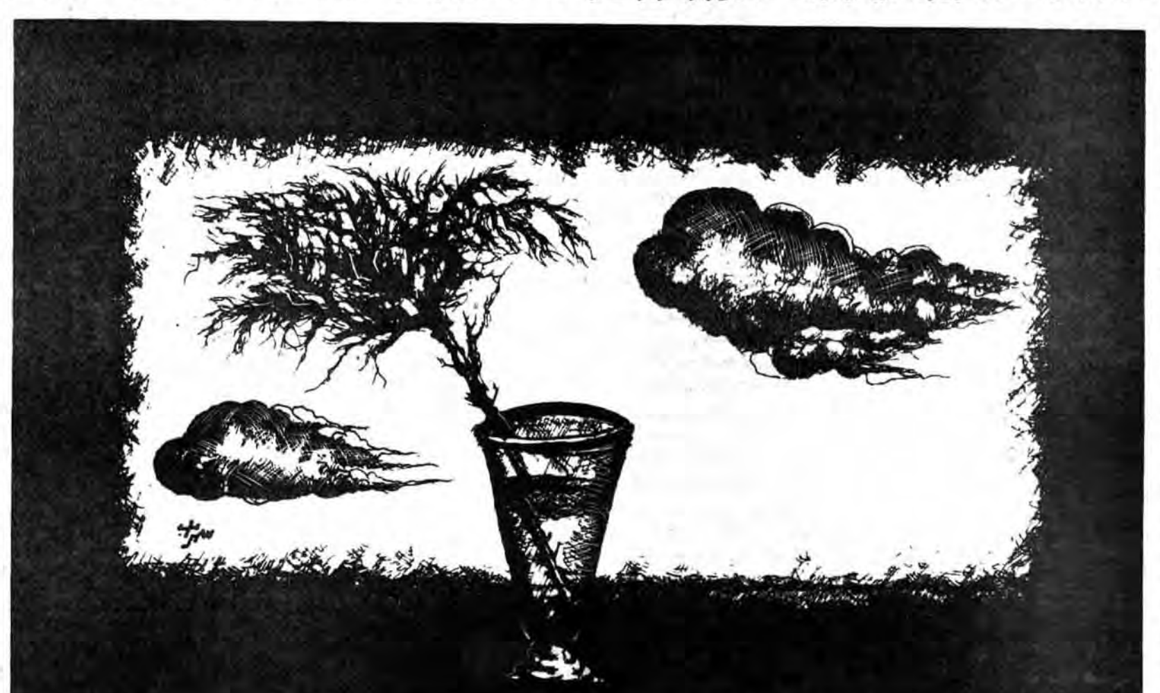
ساعت هفتاد و دو در طول تاریخ آن هم در تمامی پهنه گیتی فقط یکبار حادث شد و این خود محرمی بود باور نکردنی زیرا تا آن لحظه که حالت خاص هیچکس نمانده بود از ساعت ۲۴ نهار کند و این حادثه که سی و هجده و غریب به نظر آمد به این خاطر بود که توانسته بود به ساعت هفتاد و دو برسد.

آن شب، شبی بود نه مثل شبهای پیش زیرا ظریفتر، مشکوکیتر و غریبتر حس میشد، حتی هیچکس در انتظار ساعت بیست و پنج نبود هر چه بود در دایره شب بود. اما آن شب برخلاف تصور همه، ساعت هفتاد و دو فرا رسید. در آن شب بیچارگان و مظلومین که پارهای تن خود را برای خلافتی گهانی در آن