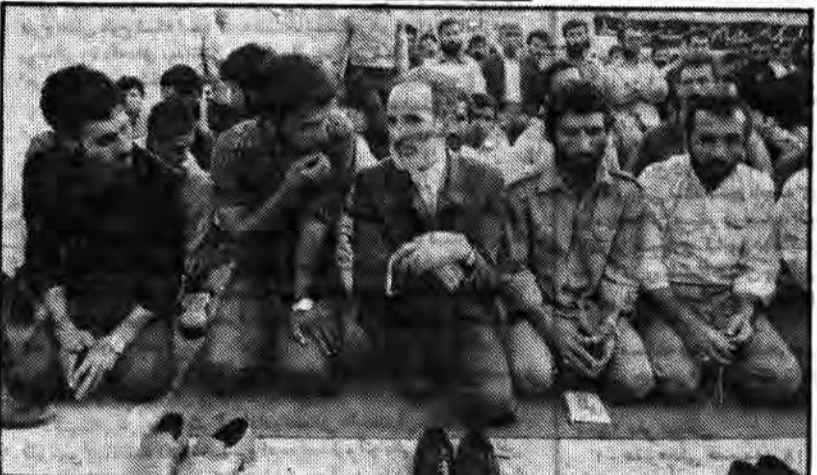
نمایندة مردم تهران در میان کارگران مسلمان