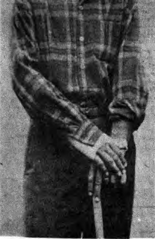
مرحوم رامسرحه میکند که «مرید امثال بکت» بوده است و آثار وی به پوچگری و «هیج انگاری» ختم میشود.

● روشنفکران غالباً از طبقات مرفه بلند شده اند.