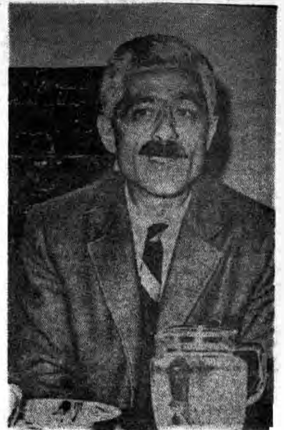
جلال آل احمد که بود؟ علیرغم اینکه در ستر بیماری افتاد، هیچ حال قلم گرفتن نداشت، اما یک مسئولیت و یک تکلیف شرعی مرا وادار کرد، تا در باره جلال آل احمد و شخصیت او چند سطر بنویسم.

این مسئولیت و تکلیفی که بنده از آن نام میبرم، مسئولیت و تکلیفی نیست که کسی آنرا به گردن من انداخته باشد و مرا مکلف به او سازد، بلکه احساس این واقعیت است که علیرغم حصول آزادی و به برکت انقلاب و جمهوری اسلامی هنوز متفکران و روشنفکران مسلمان ما به خوبی شناخته نشده اند، بدبختانه شخصیت آنان در حالی که از ابهام و ابهام فرو رفته است، یکی از آن چهره های ممالود مرحوم جلال آل احمد میباشد، اینکه چرا هنوز شخصیت جلال آل احمد میحت «روشنفکر» و «روشنفکری گری» و ترسیم موضع انقلاب اسلامی و مردم مسلمان ایران در این باب، ولو به اجمال و اختصار - و پرسش «اجتماعی آل احمد و آل احمدها» و «میزان کارائی» و «حوزه عمل» و «شیوه تفکر» و شناخت آنان، مشخص شود.