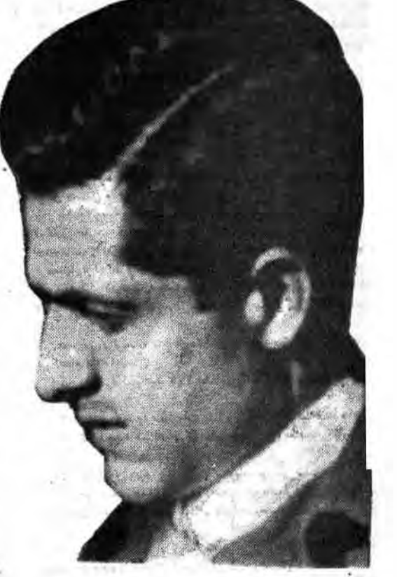
که گروهک مرموز همواره و با هر وسیله و از طرق گوناگون سعی بر آن داشته است که خود را «پیششار» و «مسترفی» معرفی کرده و دیگران را «وابستگی» و «ارتجاعی» و «میرنده» نشان دهند. به حقیقت، این یکی از خصایص و ویژگی های آن جریان و جهت است که من آنرا «روشنفکری گری» نامیدم.

● روشنفکران مسلمان «معدات» انقلاب اسلامی بودند نه علت تامه آن