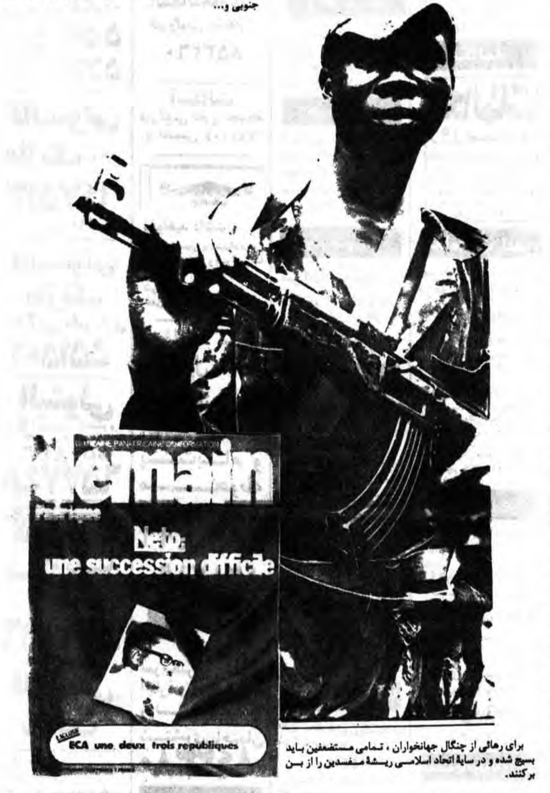
برای رهائی از جنگل جهانخواران، تمامی مستضعفین باید بسیج شده و در سایه اتحاد اسلامی ریشه سفید پستان را از بین ببرند.

«... چرا هر جا نفوذ سرمایه دار بیشتر است فساد هم گسترده تر می باشد؟ چه رابطه‌ای است بین استقلال سیاسی و مستعمره نشین‌های سیاه در آفریقای جنوبی و سایر شئون کارینوها؟ چگونه است که سیاهان در تمامی شئون زندگی از ناحیه سفید پستان وحشی تحت تبعیض قرار میگیرند، جز در فساد...» مجله نیوزویک در یک گزارش کوتاه از آفریقای جنوبی نوشته