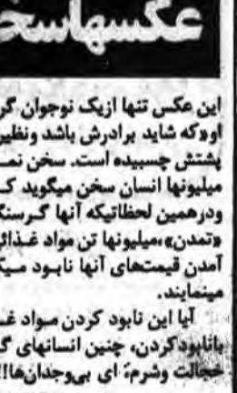
آیا این نابود کردن مواد غذایی سالم، مساوی و مترادف با نابود کردن چنین انسان‌های گرسنه در جهان نیست؟ - زهی بیخالت و شرم، ای بی‌وجدان‌ها!!!

این عکس تنها از یک نوجوان گرسنه سیاه پوست و کوله پشتی آویخته بر دوشش یادش و نظیر او شکمش از فرط گرسنگی به پیش چشیده است. سخن نمی‌گوید، بلکه از بی‌نوازی و فقر میلیون‌ها انسان سخن می‌گوید که در سراسر جهان پراکنده‌اند و در همین لحظه آنها گرسنگی می‌خورند، اروپائیان مدعی «تمدن» میلیون‌ها تن مواد غذایی را با جواهر جلاگیری از پائین آمدن قیمت‌های آنها نابود میکنند و به «کودشیمیایی» تبدیل میشوند.