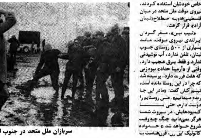
سربازان ملل متحد در جنوب لبنان

بسیاری از ساکن کنونی بهار گذشته از بیروت و «زهله» آمدند تا از جنگ میان افسران و «مسیحی‌ها» و «والا نویست» و سربازان سوری بگریزد. جمعیت «ابن الساقی» از ۹۰۰ تن در زمان گذشته به ۳۰۰۰ تن افزایش یافته است، حال آنکه «رشایه الفخر» اکنون ۳۵۰ ساکن نسبت به ۸۴ ساکن در مارس گذشته جمعیت دارد. «رشایه الفخر» یک شهر تبعیدی است.