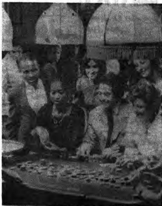
نمونه‌ای از شبکه گسترش یافته کارینوها در سراسر آفریقای جنوبی

سیاهان..... و اما استقلال واقعی را این سیاهان و دیگر مردم تحت استعمار و استعمار در جهان، روزی بدست خواهند آورد که با آگاهی و وحدت رهبریتی واحد بسپارند، در جهان رهبریتی واحد، چون اسلام نبوده، نیست و نخواهد بود. از اینرو این وظیفه است مسلمانان در سراسر جهان است تا این نیروی ۳ میلیارد نفری را بسیج کرده و با یاری اسلام که پشتوانه آن خداوند است حکومت مستضعفین را در سراسر گیتی برقرار نمایند.