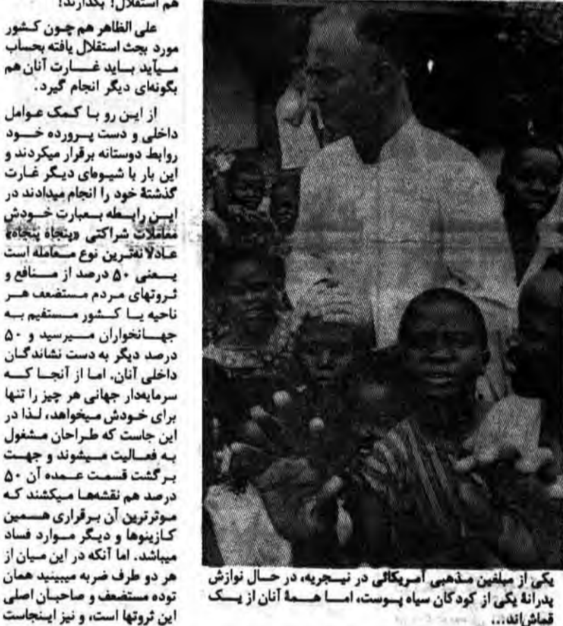
یکی از مبلغین مذهبی آمریکایی در نجره، در حال نوازش پلارانه یکی از کودکان سیاه پوست، اما همه آنان از یک قماش اند...

کرد، اما قوانین قماربازی در آنجا را نمیتوان نادیده گرفت... و میتوان مثال از ۳ مستعمره نشین (ترانسکی، بسوفوتوات و وندل) نام برد که این اواخر به استقلال دست یافتند. و منویسند، بعضی آنکه پرچم آفریقای جنوبی پائین می آید، قماربازان حرفه‌ای وارد میشوند و میزهای قمار برقرار می‌گردد. برای ۶ مستعمره نشین دیگر هم که در راه استقلال هستند پیشی می‌گیرند که به لحاظ جمعیت زیادشان باید منتظر گنوده شدن کارینوها بسیاری باشیم. یکی از مسائلی که پیشی در ریشه قماربازی