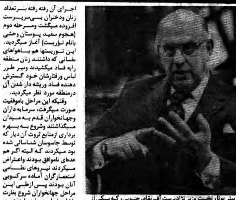
پتر پوت، نخست وزیر نژادپرست آفریقای جنوبی، که یکی از بهترین مهرهای یان اسمیت بشمار میرود.