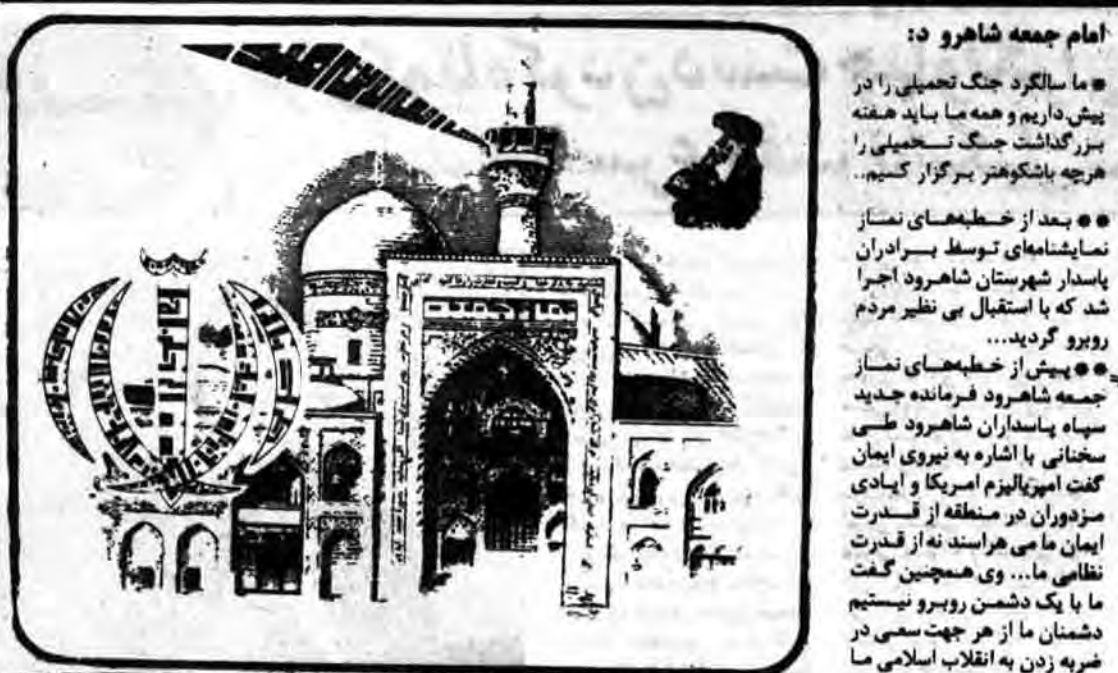
جمعه ۲۷ شهریورماه ۱۳۶۰ - ۱۴۰۱

دوشنبه ۳۰ شهریورماه ۱۳۶۰ - ۱۴۰۱ شماره ۶۶۵ - سال سوم