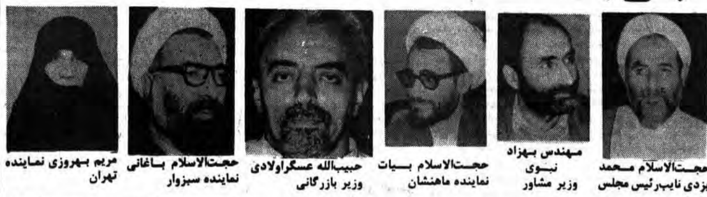
مهندس بهزاد نبوی وزیر مشاور حجت‌الاسلام محمد یزدی نایب‌رئیس مجلس حجت‌الاسلام بیات نماینده ماهنشان حجت‌الاسلام باغانی نماینده سبزوار حجت‌الاسلام عسکرواادی وزیر بازرگانی حجت‌الاسلام سبزواری نماینده تهران