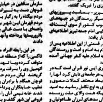
شهید محبوب دکتر باهنر در جاده ابادان - ماهشهر از یک برادر نظامی اوضاع منطقه را جویا میشود.