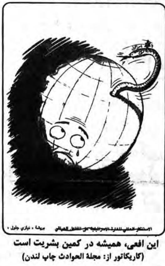
این افغانی، همیشه در کمین بشریت است (کاریکاتور از: مجله العوادت چاپ لندن)