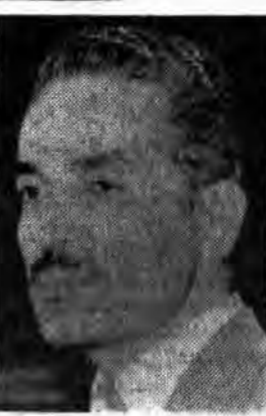
محمدعلی رجایی رئیس جمهور شهید