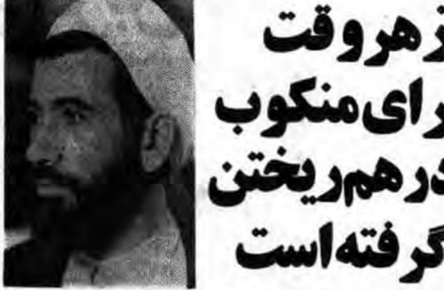
حجت الاسلام دکتر باهنر نخست وزیر شهید