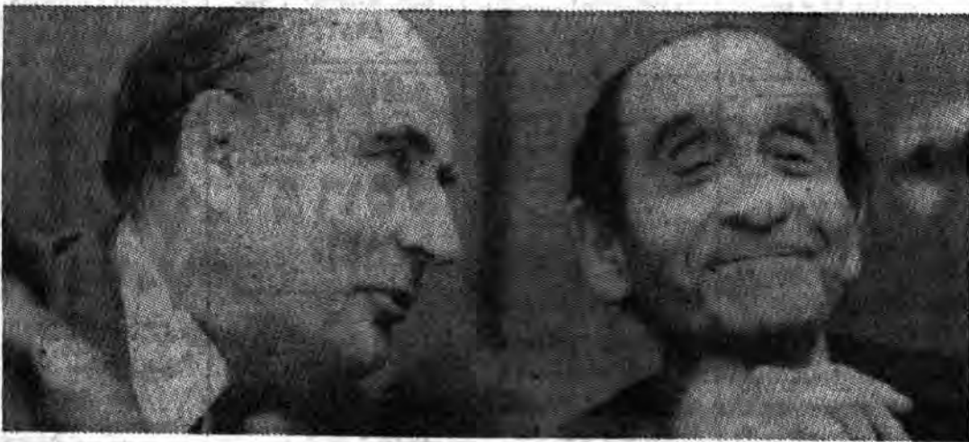
میتران شاید برای مندرس فرانس پوز نیز لایسی میخواند

فرانسوا میتران رئیس جمهوری فرانسه، با سیاست‌های مدوامش به همه و همه‌های پیش از انتخابات خود، همه هواداران بسیار خوبی در دستگاه ولیرال را شگفت‌زده کرده است. «میتران» که برای کسب آرزو به گسرو و «کسارچان» که میخواستند در فرانسه توجیه فراوان داشت، قول داده بود که هیچ جنگ‌افزایی برای عراق تأمین نکند و تأمین و دانش‌فنی هسته‌ای احتمالاً عراق را قادر به تولید جنگ‌افزارهای هسته‌ای خواهد ساخت، کاهش بدهد. او اشاره کرده بود که ترجیح می‌دهد همه فروش‌های نظامی را خاصه فروش‌های نظامی به لبی را کاهش بدهد. او همچنین آرزوی خود برای بازبند هرچه زودتر از اسرائیل را ابراز کرده بود. اظهار نظرهای سوسیالیستی امیدور