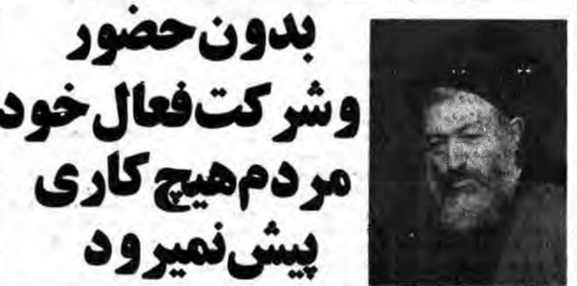
شهید مظلوم آیت الله دکتر بهشتی