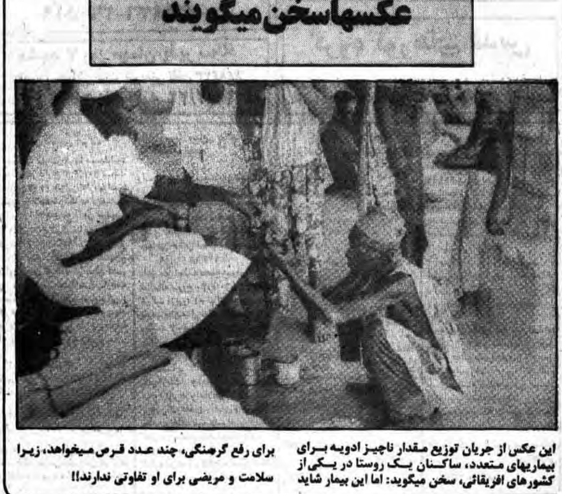
این عکس از جریان توزیع مقدار ناچیز ادویه برای بیمارهای متعدد، ساکنان یک روستا در یکی از کشورهای آفریقایی، سخن می‌گوید: اما این بیمار شاید سلامت و مرضی برای او تفاوتی ندارند!