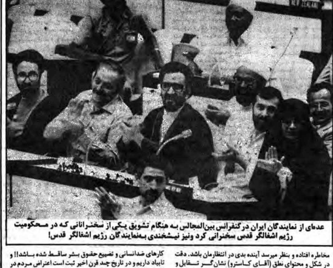
عدهای از نمایندگان ایران در کنگرانی بین المللی به هنگام تشویق یکی از سخنرانانی که در محکومیت رژیم اشغالگر قدس سخنرانی کرد

مخاطره افتاده و بنظر میرسد آینده بدی در انتظارمان باشد