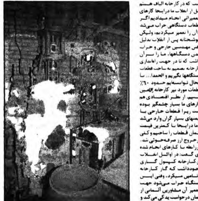
این قسمتی از دستگاه تبدیل ضایعات به مواد اولیه است که توسط برداران کارخانه الیاف ساخته شده است.

تولید این مواد اولیه صرفی کارخانه را در هر میگردد که از نظر ارزی معادل ۱۴۰۰ تن ضایعات که به مبلغ ۱۵۰۰ ریال مقدار بسیار قابل توجهی می شود. در هر سال حدود ۳۰۰ تن ضایعات در این کارخانه تولید می شود. در هر سال حدود ۳۰۰ تن ضایعات در این کارخانه تولید می شود.