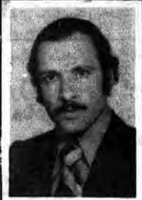
بسم رب الشهداء والصدیقین شهیدان شمع تاریخند

تا انقلاب مهدی (عج) نهضت ادامه دارد... ۱- انتخابات آزاد دارد ۲- پارلمانی دارد که در مقابل چشم بساز ملت تصمیم می گیرد و عمل میکند و تجلی عینی اراده عمومی است. ۳- در آن از خانواده های سلطنتی و هزار فامیل بقید صفحه