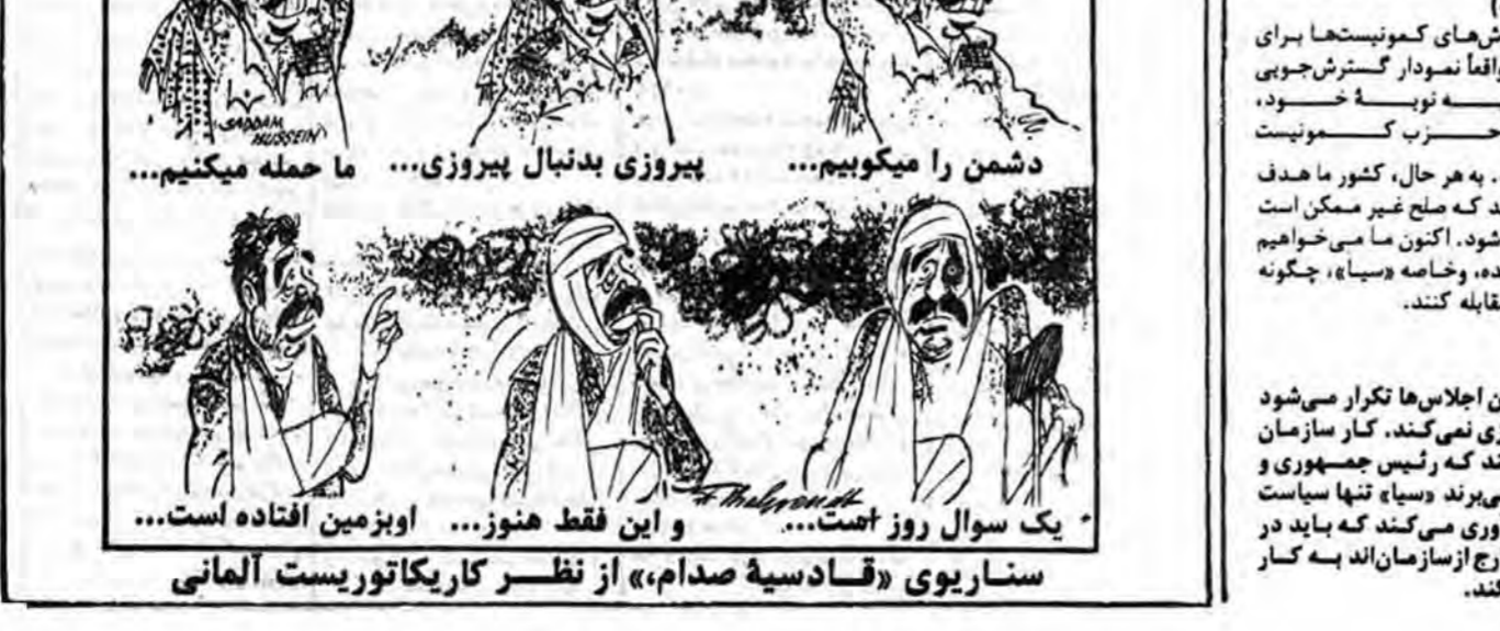
سناریوی «قادیسیه صدام» از نظر کاریکاتوربست آلمانی