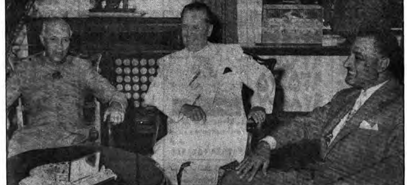
ناصر، نیتو، نهره، سه تن از بنیانگذاران جنبش عدم تعهد.

از مجله «مروری بر امور بین‌المللی» چاپ بلگراد نویسنده: ب باگونیک، استاد دانشگاه زاگرب مترجم: سید محسن شیرازی