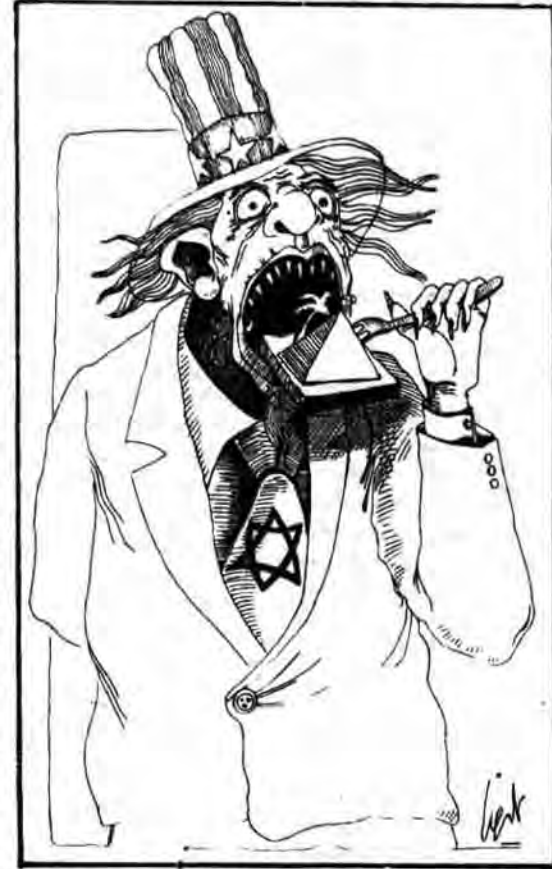
بنا بر نامه کوتبی الازاری اعلام هرگونه نقش مستقیم یا غیر مستقیم لیبی در اعدام سادات را تکذیب کرد.

از لندن خبرگزاری پرس گزارش داد: یکی از مبارزان ایرلند شمالی که برای انجام ۶ مخرانی در زمینه مبارزات مردم ایرلند در شهرهای مهم آمریکا عازم این کشور بود موفق به دریافت ویزای ورود به آمریکا شد.