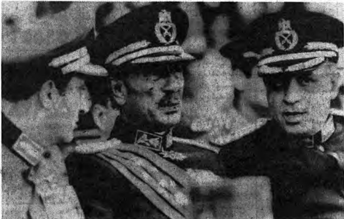
سادات لحظاتی قبل از اعدام انقلابی

این روزنامه افزوده است: بگین تروریست به قاهره رفت تا بر ریشها و زخمهای مردم مصر نمک بپاشد و به مانند سادات از رهبران تازه مصر، بوزخند زند و از مرگ سادات مانند، روزهای زنده بودنش، برای وارد کردن شره برپیکر ملت عرب استفاده نماید.