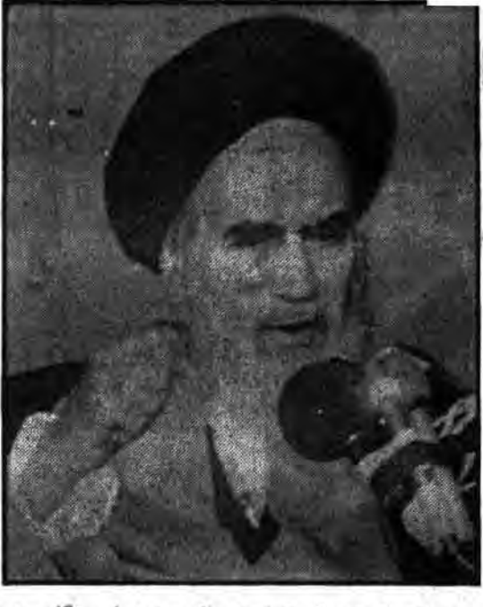
بدانید که همه قدرتهای شیطانیه، همه وابستگانه به قدرتهای شیطانیه مثل سازمان عفو بین‌المللی و دیگر سازمانها همه دست به هم داده‌اند که این جمهوری اسلامی را در اینجا خفه کنند و نگذارند شکوفا بشود.

ملت مصر بدانند که اسلام در مصر در خطر است. ملت ایران ملت معجزه‌آسای قرن است. بولقها هر چه میخواهند بگویند، مستبدین هر چه میخواهند عمل کنند، انفجارها هر چه میشود بشود، همه اینها را این ملت رزمنده بزرگ تحمل میکند. بزودی خاک ایران از لوث وجود اینها پاک خواهد شد. با قیام همگانی مستضعفین جهان فاتحه ابرقدرتها خوانده خواهد شد