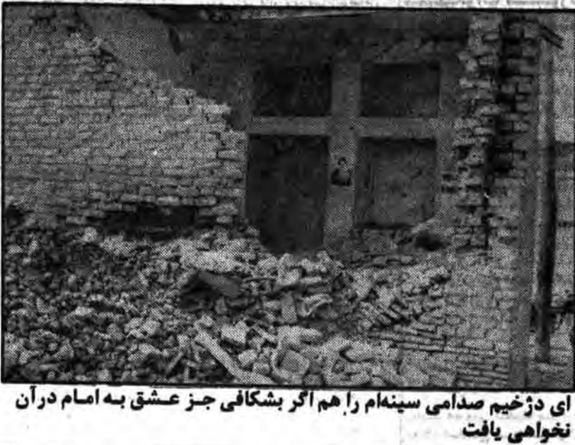
ای دژ خیم صدامی سینما را هم اگر بشکافی جز عشق به امام در آن نخواهی یافت

سینه چاکان حقوق بشر چاهرگز تقاضای دیدار از آثار جنایات صدام را نمی‌نمایند ۶ تانک و نفرپرو ۷۰ مز دور صدام در جبهه هانا نابود شدند ● پیکر آتشبار، خودرو و ۹ تانک در جبهه‌های غربی نابود شدند ● عصاره اندازان سپاه به مواضع دشمن در ام الرصاص و خرمشهر حمله کردند. ● خسارتی به ستر فرماندهی دشمن در منطقه ایلام وارد شد. در صفحه ۲