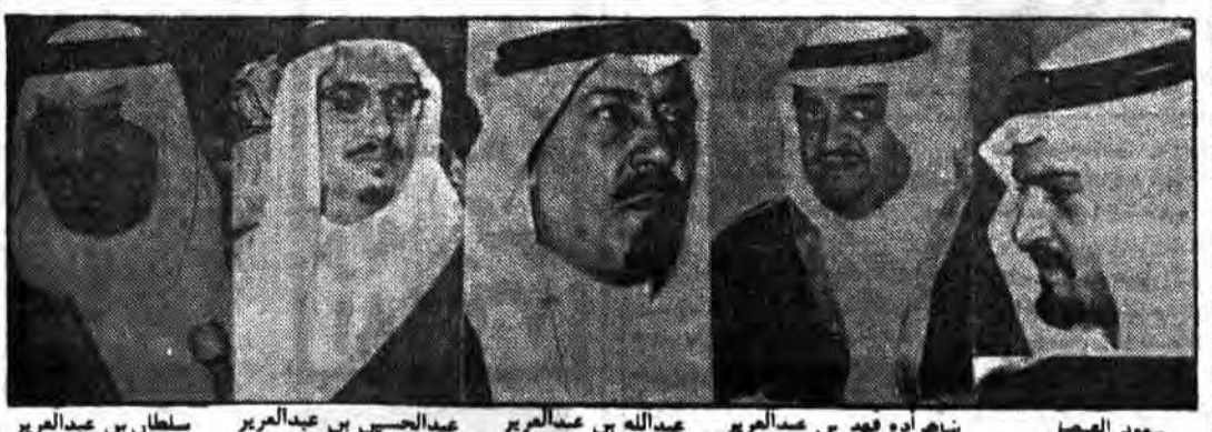
شاهزاده محمد بن عبدالعزیز، شاهزاده فهد بن عبدالعزیز، عبدالله بن عبدالعزیز، عبدالرحمن بن عبدالعزیز، سلطان بن عبدالعزیز از گروه استیون نشنال