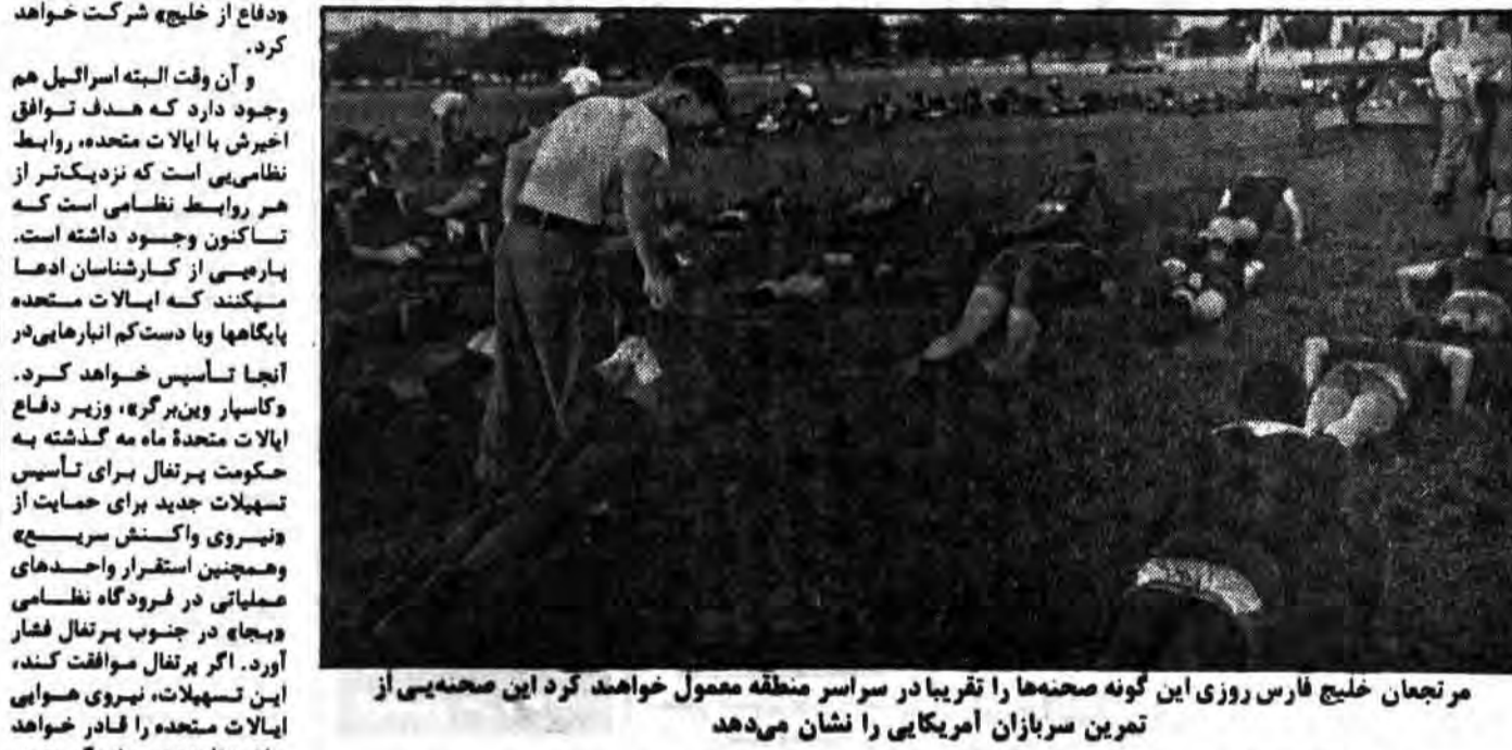
مرجعان خلیج فارس روزی این گونه صحنه‌ها را تقریباً در سراسر منطقه معمول خواهد کرد این صحنه‌ی از تمرین سربازان آمریکایی را نشان می‌دهد

متوسط هم اکنون مستقر شده است. بسیاری از اسلحه‌ها ۵۷۲ موشک و گروم و هیرشنگ در طول چند سال آینده، تصاعد بزرگی در مسابقه تسلیحاتی است.