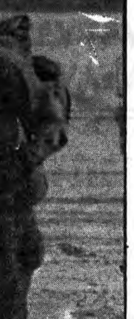
سربازان متجاوز آمریکایی در جستجوی پایگاه

شده است. برای همین است که کارشناسان آمریکایی از پوزیشن‌های ریگان، خواستارند روی گسترش نیروی واکنش سریع و نیروهای دریایی در مدیترانه شرقی و اقیانوس هند تکیه کنند. حکومت جدید بی‌درنگ بودجه نیروی واکنش سریع را دو برابر ساخت و آن را تقریباً به ۱۶ میلیارد دلار رساند. به گفته نشریه «مجاز» بررسی استراتژیست‌ها، این نیرو شامل واکش سریع و دوم هوایرد