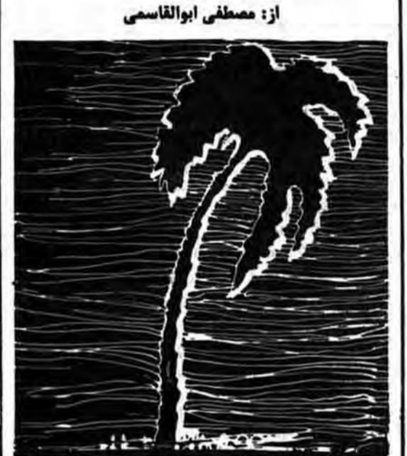
از: مصطفی ابوالقاسمی