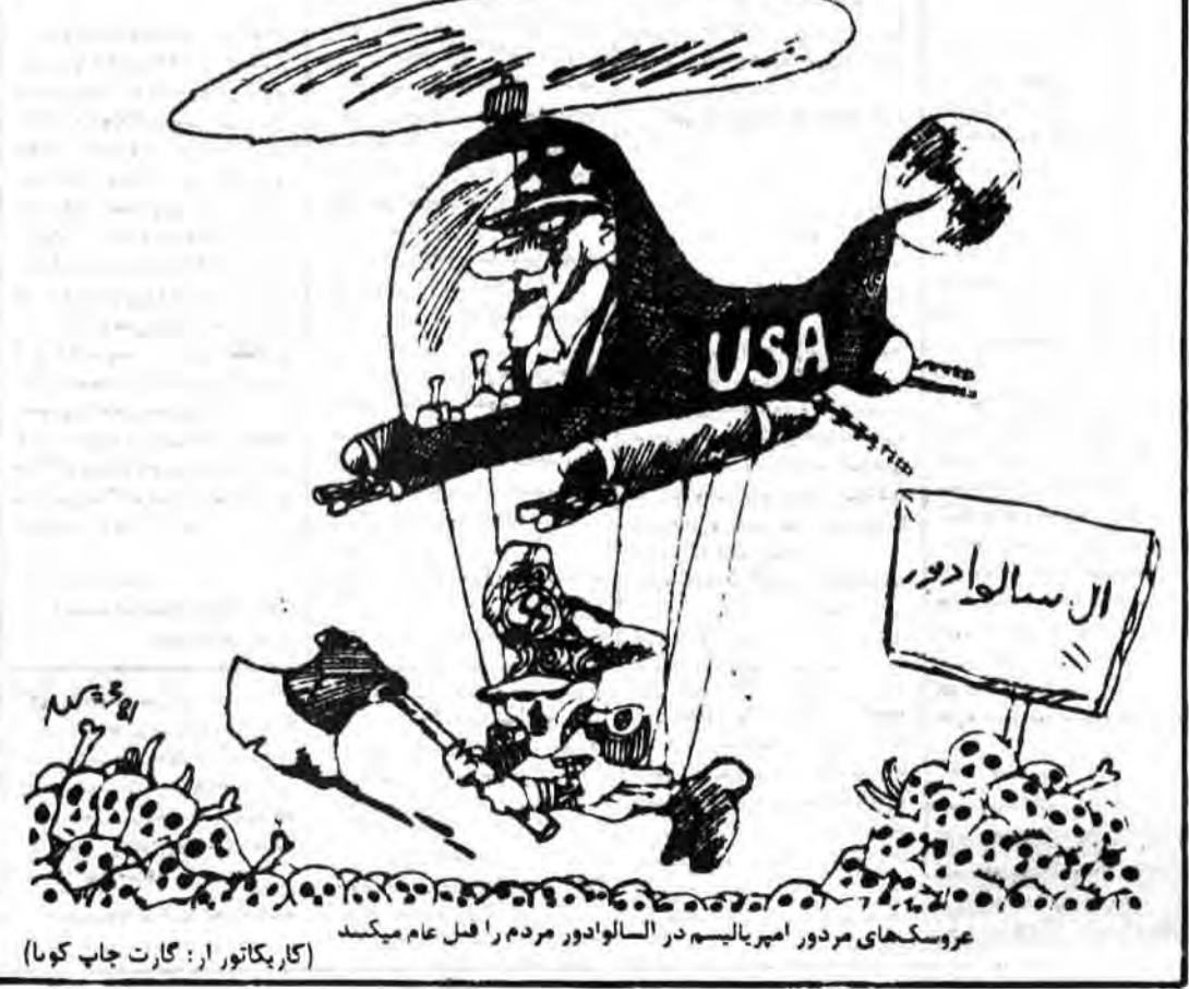
عروسک‌های مردور امپریالیسم در السالوادور مردم را قتل عام میکند (کارکاتور از: گارت چاپ کوما)