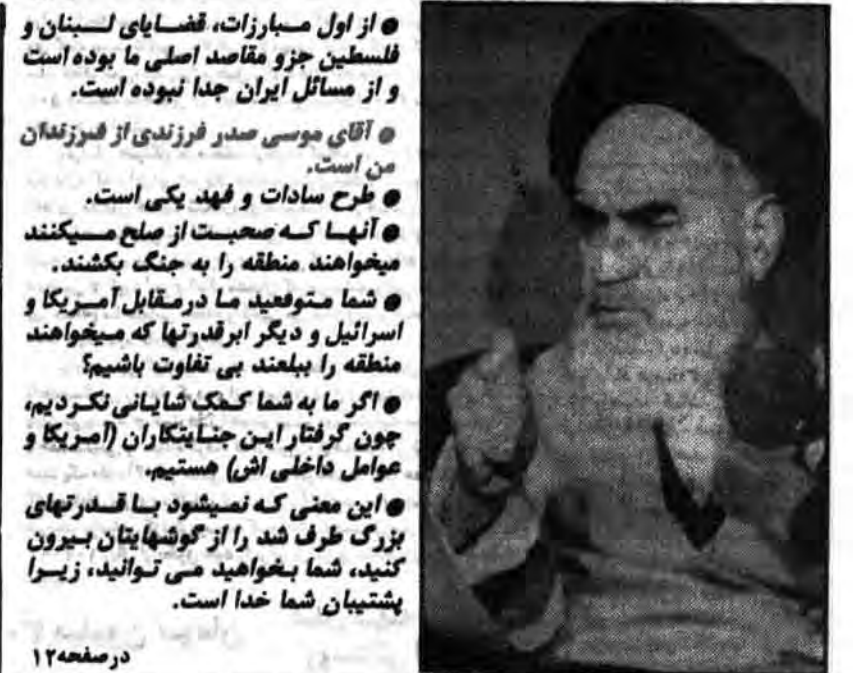
ما با هیچ کدام از ابرقدرتها و قدرتها سرسازش نداریم

از اول مبارزات، قضایای لبنان و فلسطین جزو مقاصد اصلی ما بوده است. و از مسائل ایران جدا نبوده است. آقای موسی صدر فرزندی از فرزندان من است. طرح سادات و فهد یکی است. آنها که صحبت از صلح میکنند میخواهند منطقه را به جنگ بکشند. شما متوجهید ما در مقابل آمریکا و اسرائیل و دیگر ابرقدرتها که میخواهند منطقه را ببلند بی تفاوت باشیم؟ اگر ما به شما کمک شایانی نکردیم، چون گرفتار این جنایتکاران (آمریکا و عوامل داخلی اش) هستیم. این معنی که نمیشود با قدرتهای بزرگ طرف شد را از گوشه‌ایان بیرون کنید، شما میخواهید می‌توانید، زیرا پشتیبان شما خدا است.