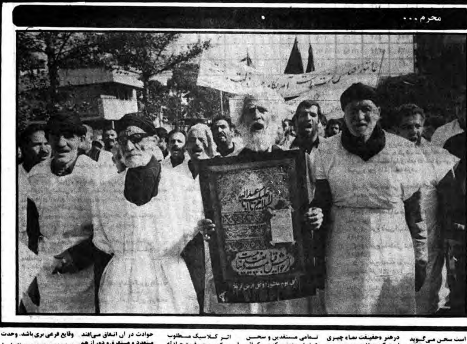
مجموعه فرهنگی از اعضای مرکز اسلامی تئاتر

● برامت آگاه و مسلمان است که به روشنی بر مسائل توجه داشته باشند و با هر گونه حرکت سودجویانه شیدا بر خورد کرده