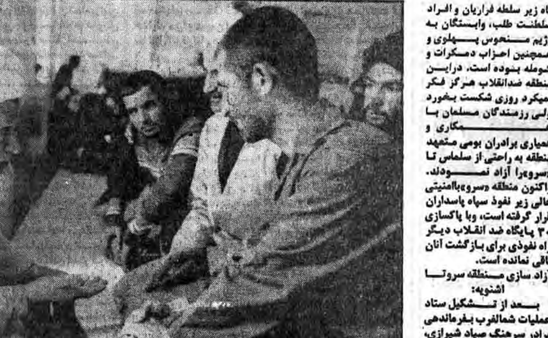
فرمانده سپاه پاسداران در شبستان مسجد آشنویه با برادر قاضی محمد خضری در حال گفتگو در مورد مسائل این منطقه میباشد.

بشمار صدها مرد این بخش از طرف غرب به کشور عراق و از شرق به نهد و از جنوب به پیرانشهر و از شمال شرق به ارومیه و از شمال غرب به سلولان منتهی میشود. قبل از آغاز عملیات توطئه بزرگی در حال شکل گرفتن بود و آن جمع فرمان سواکی و فراری و بختیاری در منطقه بود که جهت گسترش ارتش آزادی بخش گرد هم آمده و طرح‌هایی را به کمک قاسملو و مجاهدین خلق و تمام عناصر ضد انقلاب ریخته بودند. اما خوشبختانه این مسئله افشا شد و پس از تصمیم گیری برادران در ستاد عملیات شمالغرب غسینی گردید. در پاکسازی مناطق اشغالی هر چند که ضدانقلاب برای مدارائی در مسائل سلحشوران مسلمان از نیروهای خود که در سپاه بودند کمک گرفت ولی انجام عمره را تنگ دید با بجای گذاردن دهها کشته و زخمی و اسیر و تعداد زیادی مہمات فرار را بر قرار ترجیح داده و به طرف روستاهای اطراف آشنویه متواری شد و در آشنویه که یکی از پایگاههای اصلی ضدانقلاب بود، به اسید آنکه هرگز دولت جمهوری اسلامی به آنجا دست پیدا نخواهد کرد، مستقر گردید و با ایجاد دادگاه و گرفتن مالیات تشکیل دولت داد و چنان سیستم دیکتاتوری بر این منطقه حاکم نمود که کسی را یاری سخن گفتن نبود و چنان تسلیحاتی بر صلیبه پاسداران و دولت جمهوری اسلامی برافراخته بودند که بعد از آزادی آشنویه مردم وحشتزده از پاسداران دوری می‌نمودند اما رفتار و کردار پاسداران و برادران ارتشی با آنها بخوبی بود که بعد از گذشت دو سه روز از نیروهای رزمندگان اسلام استقبال به عمل