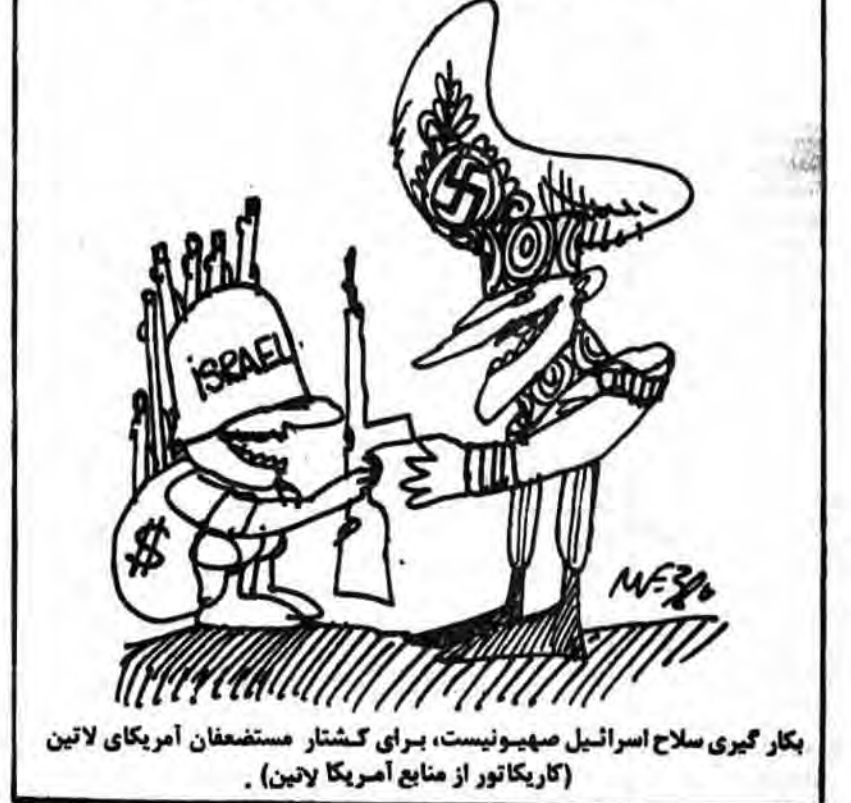
بکارگیری سلاح اسرائیل صهیونیست، برای گشتار مستضعفان آمریکای لاتین (کاریکاتور از منابع آمریکا لایتن).