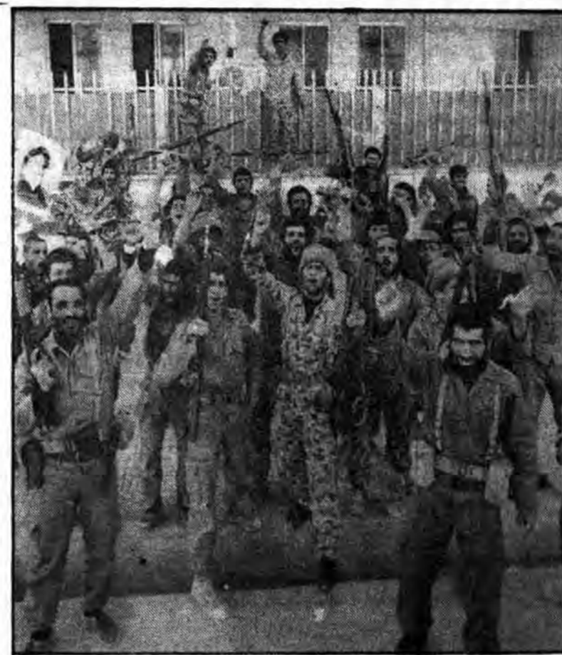
لحظه پیروزی بعد از تسخیر بوکان و رزمندگان شادمان از این فتح بزرگ.

شد انقلاب تار مار گردید تا اینکه نیروهای رزمنده اسلام در روز شنبه ۱۱/۷/۶۰ در ساعت ۸ صبح از دو محور تهمای مشرف به بوکان را فتح نمودند و در ساعت ۸:۳۰ دقیقه برادران جان بر کف سپاه پاسداران و پیشروان مسلمانان وارد داخل شهر بوکان شدند و ضد انقلابیون که از ورود جان بر کفان اسلام اطلاع داشتند قبلاً شهر را ترک نموده بودند و به گوهای اطراف بوکان گریخته بودند مردم مسلمان