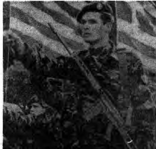
خود را با «نانو» و «سپان»

مشکلات اقتصادی، ساده بود که یونانی‌ها را با توجه به وضع مالی مردم، برای رای دادن به آموری که به بهبود وضع مالیشان مربوط می‌شد به پای صندوقهای