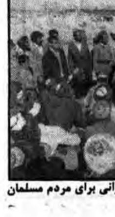
یکی از فرماندهان عملیات شمال غرب کشور در حال سخنرانی برای مردم مسلمان بوکان.

در سطح ایران است مردم کرد اغلب جذب تبلیغات رفاهی میشوند و به همین خاطر خودمختاری برایشان گریزناپذیر و لذت بخش است و با این معنای واقعی خود را منظور از انتظار میروند.