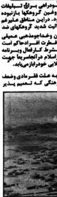
شهر بزرگ و زیبای بوکان دیده میشود که پس از ماهها اسارت بدست رزمندگان سلحشور آزاد گردید.

مناطق ۱- دولت و دست اندرکاران جمهوری اسلامی باید در اجرای بسند ج و د کوشا باشند و به جدیت به این مسائل رسیدگی نمایند. ۲- دولت باید با در اختیار قرار دادن وسائل اولیه کشاورزی به مردم مسلمان