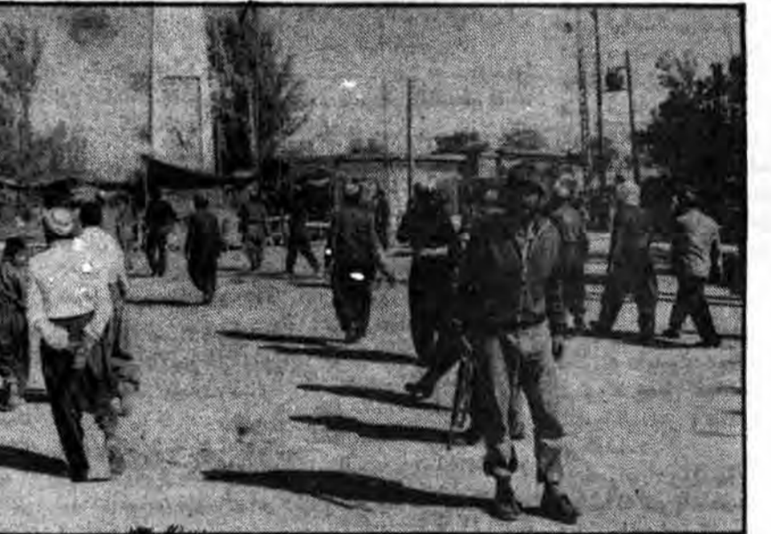
میدان بزرگ بوکان که مردم بسوی رزمندگان میروند تا ورودشان را خیر مقدم گویند.

کرد در بوکان پس از شنیدن خبر ورود رزمندگان اسلام به شهر بوکان از منزل با بیرون آمده و به استقبال برادران ارثی و سپاهی خود شتافتند و دست به یک