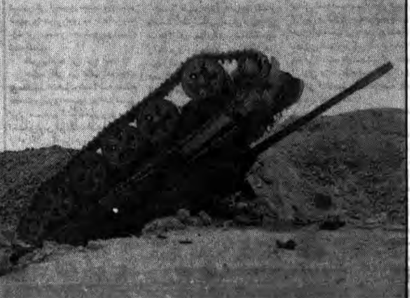
آری آنکه عمواره بر سلاح مدرن تکیه می‌کنند تا چند صباحی بر او بریکه قدرت پشتیبند و مستضعفان را در بند کشند باید بدانند که سلاح مدرن در برابر اعجاز سلاح ایمان زبون و ضعیف است و اکتون دنیا می‌بینند و می‌شنوند که رزم آوران اسلام با سلاح ایمان چگونه بر خصم کافر که تا بن دندان توسط جهانفوران مسلح گردیده می‌شورند و او را به عجز می‌کشند.

۲۳۸ بیمار پزشکیار و امدادگر عازم جبهه شدند. در صفحه ۲