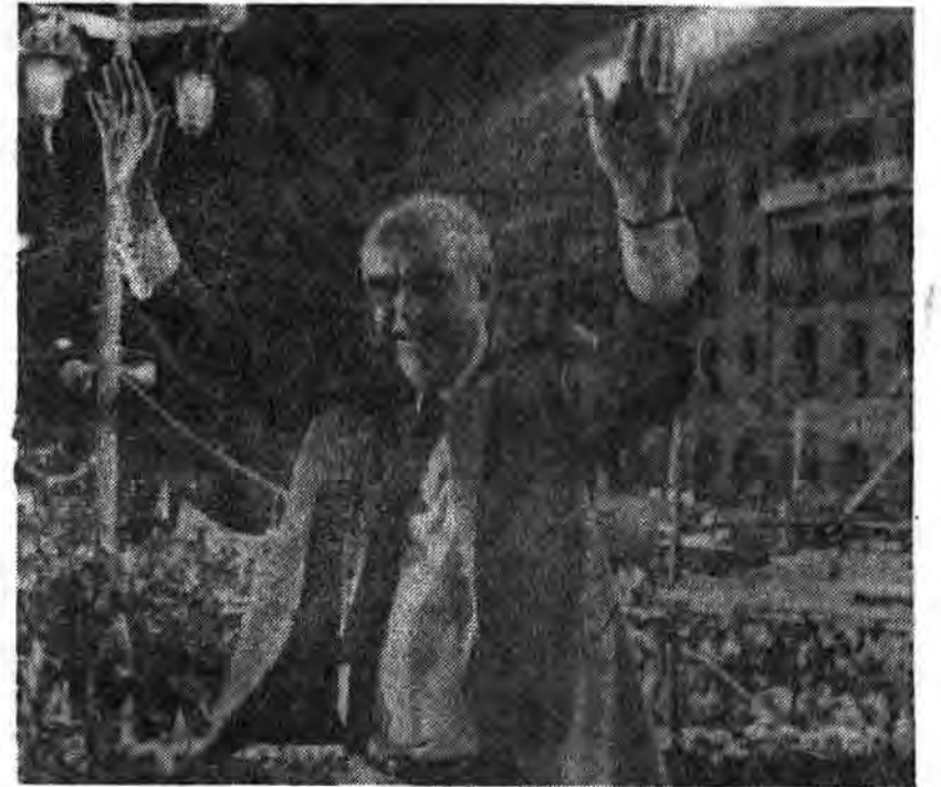
پاندر در گروه می این طرفدارانش

برای آنکه هر شکست جناحهای وایسته به خود را در سراسر جهان وایسته به عوامل اقتصادی و تبلیغاتی نامناسب بداند به آن دلیل است که ذهن خوانندگان پاندر را از دلایل اصلی و در آریس آنها نفرت ملل جهان را از آمریکا و سببهای آن دور نماید.