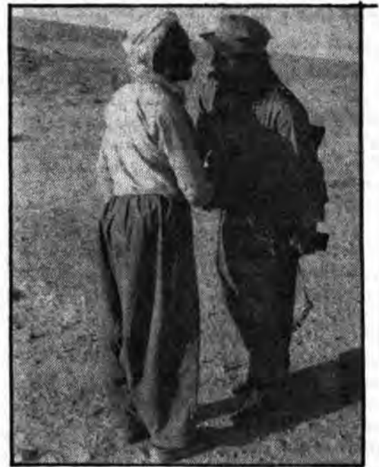
برادران کرد با استقبال شایان خود مقدم برادران ارثی و سپاهی خود را گرامی داشتند.

کردند با اسارت کما فی السابق در شهر بوکان با هوایی مشاهده می شد که چه کسانی در این شهر رخنه نموده به مردم بی گناه کرد ظلم و ستم روا می داشتند. ضد انقلاب چنان اکراد مسلمان ساکن در این شهر را در منگنه قرار داده بود که هیچ کسی جرئت اعتراضی نداشت مردم بوکان بنزین را لیتری ۴۰ تا ۵۰ تومان می خریدند و مواد غذایی به ندرت به دستشان می رسید و اگر هم به آن دست پیدا می نمودند و عملکردها مشخص می شد که چه کسانی سنگ خلق کرد را به سینه می زدند و شمار آمریکایی خودمختاری کرد را سر می دادند. این به خوبی ملت مسلمان ایران به خصوص خلق مسلمان کرد روشن شده است که اینها سزودان خود فروخته آمریکایی هستند و به دستور اربابشان برای ایجاد اغتشاش و آشوب و جلوگیری از به رسیدن انقلاب اسلامی وارد عمل شده اند. خلق مسلمان کرد به خوبی دریافته است اسلام اصیل و جمهوری اسلامی پشتیبان کلمه سحرآمیز و رهبران کلمه مستقیمین از سلطه مستکبرین است و به همین علت است که دیگر خلق مسلمان کرد چون گذشته ملحه دست این عناصر پلید قساز نگرفته و دودشود رزمندگان مسلمان در جبههها می رزمند و برای بازسازی شهرها به یاری برادران جهاد سازندگی می شتابند و این همبستگی باعث گردیده است که ضدانقلاب و گروههای