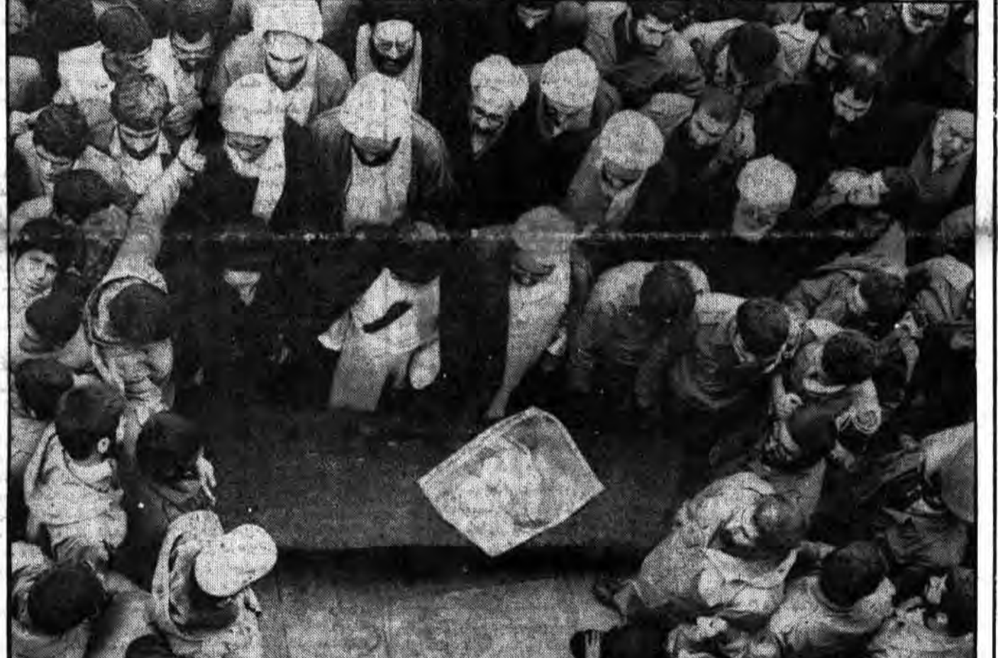
آیات عظام و علمای اعلام و نمایندگان شورای عالی قضائی، مجلس شورای اسلامی و اساتید حوزه علمیه قم و ائمه مختلف مردم بر پیکر پاک علامه طباطبائی نماز می‌گذارند.

دیروز در مدرسه عالی شهید مطهری: مردم تهران یاد فیلسوف شرق، عالم ربانی آیت‌ا... طباطبائی را گرامی داشتند • مردم سراسر کشور با شرکت در مجالس بزرگداشت به سوگ رحلت علامه طباطبائی نشستند. • سیل تلگرامها و پیامهای تسلیت در فقدان آیت‌ا... علامه طباطبائی در صفحه ۱۰