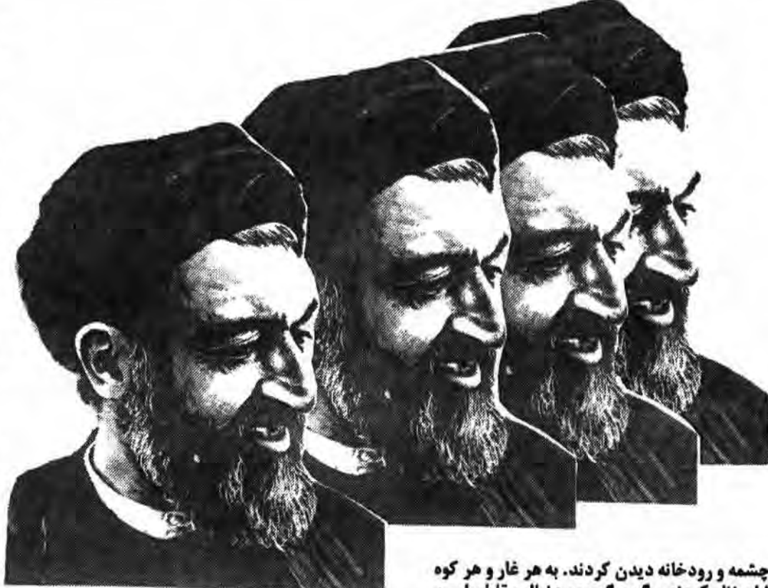
داد... در راه خدا داد... حافظ سیل خون بیچارگان خداست

منافق گوش کن... تو منافقی فقط همین. منافق خوب گوش کن... تو منافقی فقط همین. منافق خوب گوش کن... تو منافقی فقط همین.