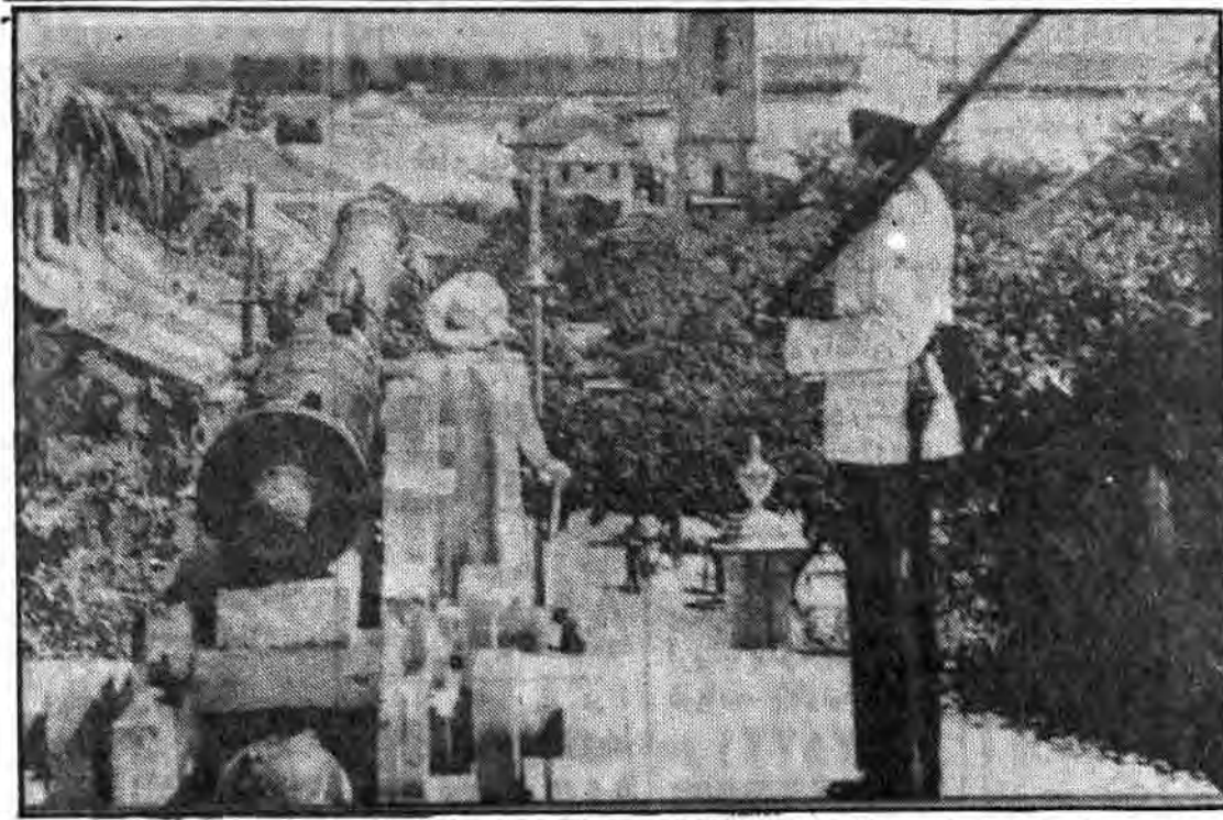
جزایر باهاما و ناساوه سالسیانه تعداد کثیری جهانگرد رامی پذیرد، که یکی از جاهای دیدنی مفر حکومتی ناساوه است که در تصویر مشاهده میگردد. تعداد کثیری از این توبهها را استعمار انگلیس و دیگران برای سرکوب مستضعفین جزایر بکار بردند ساختمان سفیدی که در مقابل لوله توب قرار دارد، جایگاه کریستف کلمب (بزرگترین سیبشویای استعماری اسپانیا)

۳ فرودگاه قابل استفاده که یکی دارای باند آسفالت ۲۷۴۵ متری است. ارتباطات رادیویی- سیستم خودکار تلفن، شامل ۲۸۰۰ عدد تلفن (هر صد نفر ۴۸ عدد تلفن) ارتباطات پراکنده در موج بسیار کوتاه بین «تورولو» و «سنت لوسیا»- ۳ ایستگاه رادیویی AM- ۲ ایستگاه رادیویی FM و یک ایستگاه تلویزیونی علاوه بر یک کانال زبر دریایی هم محور نیروی دفاعی: نظام امنیتی شامل، دفاع آنتیگوا و باربودا (متشکل از نیروهای نظامی و داوطلب شامل ۸۰ سرباز نیمه وقت که در حال حاضر دارای ۲۳ فرودگاه است، اما طرحی برای ۱۶ آفر و ۱۰۰ سرباز در دست اجرا میباشد)