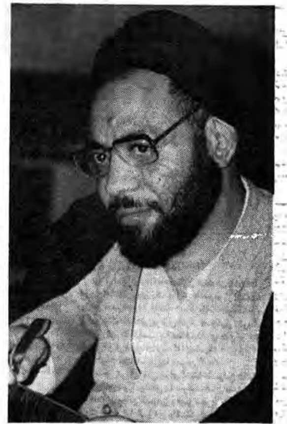
اهواز - حریک جمهوری اسلامی در پی دومین نشست اتمه جمعه استان خوزستان به حضور سران راهبردی، حجت الاسلام موسوی خراسانی رسیدند تا در زمینه سیاست و مسائل دیگر توضیحاتی بدهند. مس صفا شرح زیر است.

داشته باشیم و راجع به آنچه وظیفه امامان و ائمه است با ما هم تبادل نظر کنیم... این برنامه دوسر است که عملی می شود و الحمد... موفقیت آمیز هم بوده است.