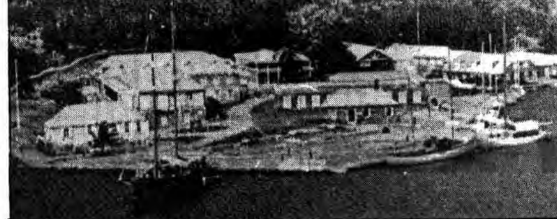
نلسو نزدک یارد، در بندرگاه انگلیسی- آنتیگوا واقع در آنتیل کوچک

بهر حال، روز ۱۰/۸/۱۰-۱۳۶۰- آسوشیتد پرس از آنتیگوا گزارش داد، که جزیره کوچک آنتیگوا در دریای کارائیب سرانجام پس از ۳۵ سال از استعمار انگلیس خارج شد و به استقلال رسید، همزمان با اعلام استقلال این جزیره که با حضور شاهزاده سارگرت