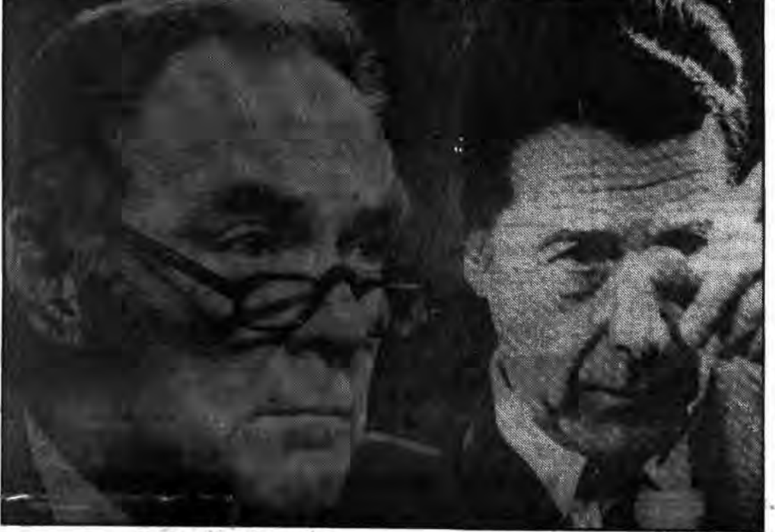
هنری کیسینجر وزیر امور خارجه آمریکا

دولت ریگان امید دارد که حدود بهار سال بعد، یا پانصد و پنجاه خواهد داد که پایگاهها در آوا کمک های اقتصادی آینده آمریکا به یونان، در خاک آن کشور باقی بمانند. در سال آینده نیروهای مسلح یونان ۳۶۰ میلیون دلار کمک از آمریکا دریافت خواهند کرد (ارتش یونان بسبب تیز تر هواپیماها و اسلحه های ساخت آمریکا استفاده میکند). یک مقام رسمی آمریکا گفت: «ما به هم محتاجیم» و درست مثل عشاق، و اغلب حرفهای گفته شده در حال شهنوت، روز روز به یاد هیچکدام نمی ماند.