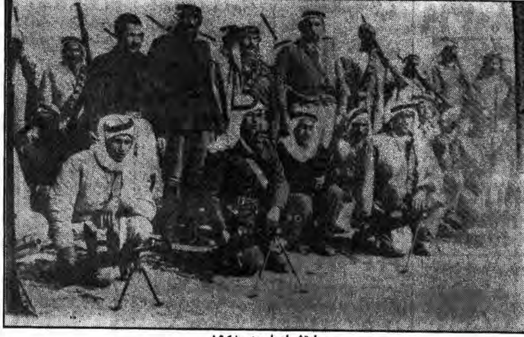
ارتش اعراب در ۱۹۴۸

اوضاع خاص منطقه خاورمیانه بخصوص دو نقطه مهم اسرائیل و مصر بوده است و کانال سوئز و خلیج فارس همواره این دو (استعمار کهن و جدید) سعی وافر داشته اند که در مناطق تحت تسلط و با لاف و با سلاح خود را تقویت نمایند که وجود جنگ بین مصر و اسرائیل مانع ایجاد صلح و امنیت در این حوزه شده بود. در این مورد وجود رژیم اشغالگر قدس، صلح و ابرای اعراب و پیوسته سادات ناممکن نموده بود. زیرا او میدانست که صلح با اشغالگران قدس که حاصلش به رسمیت شناختن غاصبان است، ختم نموده های میلیون مسلمانان جهان را بدنبال خواهد داشت ولی در جایی که خواست استعمارگران در یک طرف و خواست ملتها در طرفی دیگر قرار میگردد، مزدورانی چون سادات در برابر اربابان استعمارگر سر