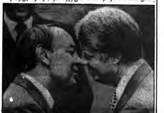
شاه حسن دلال و کارگزار قرارداد کمپ دیوید

قبل از روی کار آمدن سادات در مصر، جمال عبدالناصر رهبری مردم مصر را سعه داشت. ناصر توانست تا حدودی تحولاتی در جامعه مصر بوجود بیاورد. از جمله اهداف جمال عبدالناصر در جهت نیل به استقلال و آزادی و خود کفائی، بستن کانال سوئز (یعنی شریان حیاتی امپریالیسم صهیونیسم) بر روی کشتیها و قوای آمریکا و متحدانش از جمله اسرائیل بود. ولی امپریالیسم آمریکا با همکاری و همکاری رژیمهای مرتجع منطقه وستون پنجم خود که مرکز آن عوامل صهیونیسم بود توانست کودتائی علیه ناصر ایجاد کند و او را از صحنه سیاست خارج نماید و حتی او انور سادات را به حکومت مصر بنشاند. عامل شکست ناصر در جنگ شش روزه اعراب و اسرائیل وجود