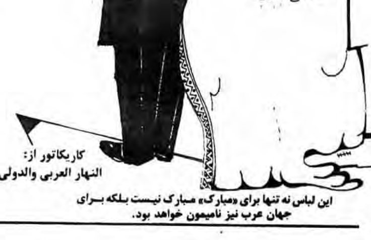
این لباس نه تنها برای «عیارک» مبارک نیست بلکه برای جهان عرب نیز نامیون خواهد بود.

همه میدانند که در جنگ ویتنام، ایالات متحده در حمله به غیر نظامیان و حیوانات، استفاده وسیعی از عوامل شیمیایی بسیار سمی و گیاه کشایی کرد که به محصولات، کشتزارها و جنگل ها صدمه وارد میکند. همچنین معلوم شده است که پایگاههای سری در ایالات متحده وجود دارد که در آنها جنگ افزارهای بیولوژیک و شیمیایی ساخته میشود. در این پایگاهها، بررسی های جدی درباره استفاده از حشرات به عنوان ناقلان بیماری انجام شده است. مثلاً، پشه های آلوده به تب زرد، مالاریا، مگس های خانگی آلوده و ویسا، سیاه زخم و اسهال خونی، ارتش ایالات متحده و نهادهای دیگر، آزمایش های منظمی را با این گونه ناقلان بیماری برای هدف های نظامی انجام میدهند. این نهادها، این کار را در مناطق مستونی هم انجام میدهند. موضوع به کار رفتن جنگ افزارهای بیولوژیک علیه کوبا، در