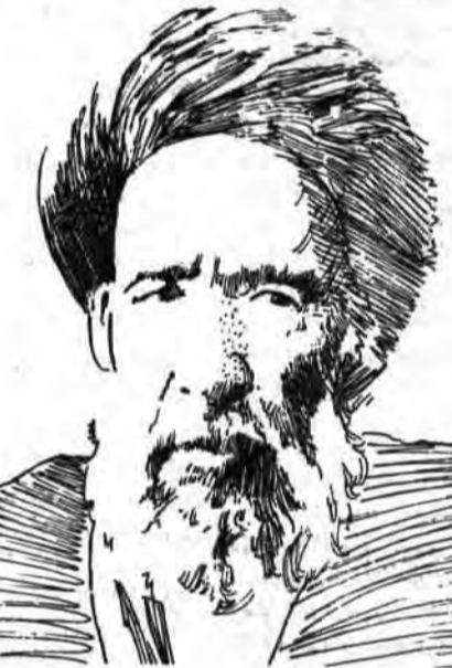
بسم الله الرحمن الرحيم

مدرس دومین شهید مشروعه، مشروطه‌ای باشد که بتدریج از مردم فاصله گرفت و کار انحراف بدانجا کشید که از بطن آن حکومت انقلابی دیکتاتوری سیاه و رضاخان روئید.