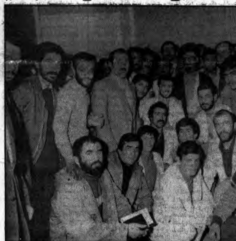
افتخار آفرینان جمهوری اسلامی، سفیرانی که با نیروی جسمانی و معنوی خود انقلاب را به اقصی نقاط جهان صادر می‌کنند. آنها که اخیراً با کسب پیروزی در خردان و تحصیل عنوان قهرمانی فریاد... اکبر و خمینی رهبر را در میدان پرجمعیت طنین انداز کردند در میان حجت الاسلام والمسلمین سید علی خامنه‌ای رئیس جمهور محبوب دیده میشوند و بشارت موفقیت را برای او به ارفغان آورده اند.