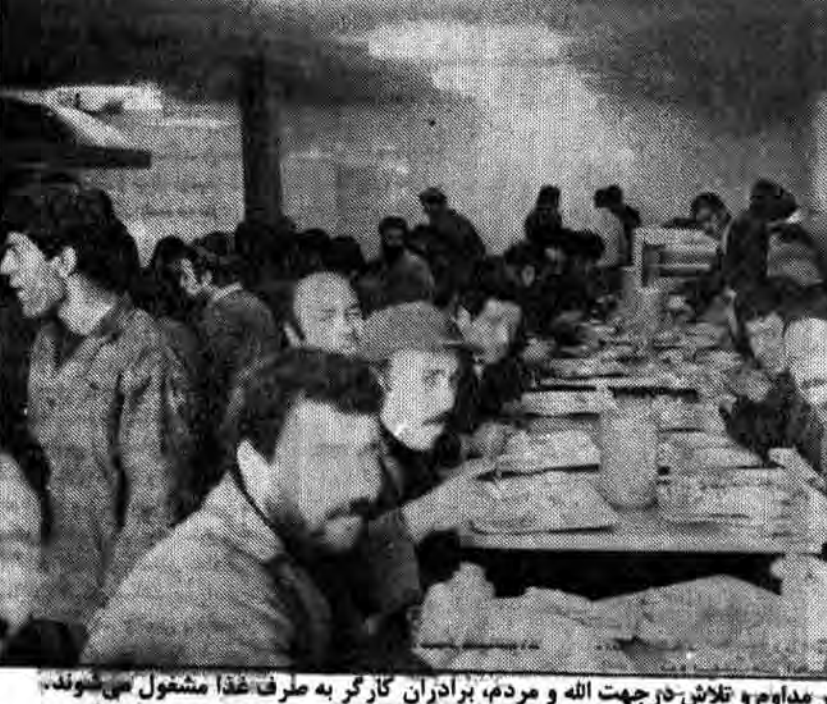
پس از چند ساعت کار مداوم و تلاش در جهت الله و مردم، برادران کارگر به طرف غذا مشغول می شوند.