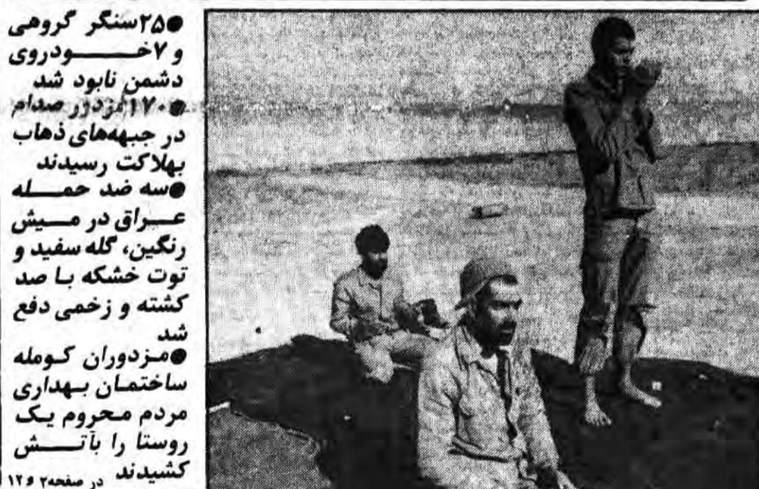
ایران با که سخن میگوید و با کدامین معشوق خلوت کردداند و سه راز و تیراز نشسته‌اند که اینچنین فارغ از دنیا و مباحی اطراف او را می‌نگردند؟ آری راست گفت آن رزنده اسلام که اگر می‌خواهی نظاره گر خدا از نزدیک باشی سری به جبهه‌های جنگ بزن!! اللهم برحمکم فی الصالحین فادخلنا

بمناسبت ۲۸ صفر: امت مسلمان ایران راهپیمائی خواهد کرد در صفحه ۲۸