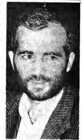
سرریس سیاسی جمهوری اسلامی پیش از ظهر دوسر