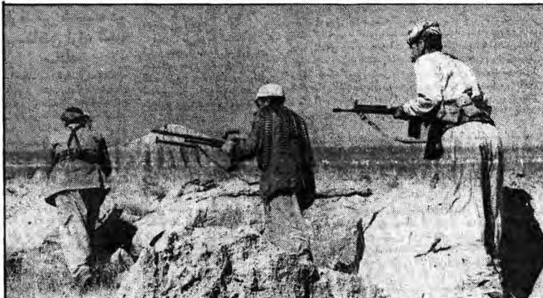
حماسه آفرینان ارض مقدس ایران در یک نبرد نامتوازی از نظر تجهیزات و صدور صد مسزید بر خصم از حیث ایمان و اعتقاد بر استمداد الهی با تصرف مواضعی که دشمن آنها را اشغال نموده است می‌روند که او را بر آن طرف مرزها برانند تا درس عبرتی را بیاموزند بر آنکه اهنگ تجاوز درس پرورانده و در صدد از بین بردن تمامیت ارضی سرزمینی برآیند.

بسیارستانیهای آبادان در شب رحلت پیامبر اکرم (ص) مورد حمله توپخانه عراق قرار گرفت بدنبال فرار مفتضحانه مزدوران صدام: اراضی آزاد شده در جنوب سابله به ۱۳۰ کیلومتر مربع رسید ۷ تانک و ۸ سنگر گروهی دشمن در گیلانغرب منهدم شد در صفحه ۲