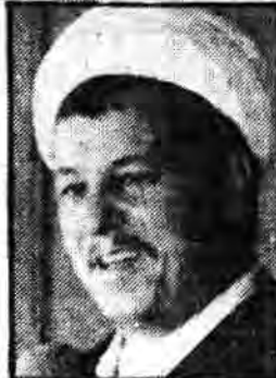
رئیس مجلس شورای اسلامی در ملاقات با علمای اهل سنت:

بین اهل سنت و شیعه بیش از همه وقت تفاهم و دوستی وجود دارد