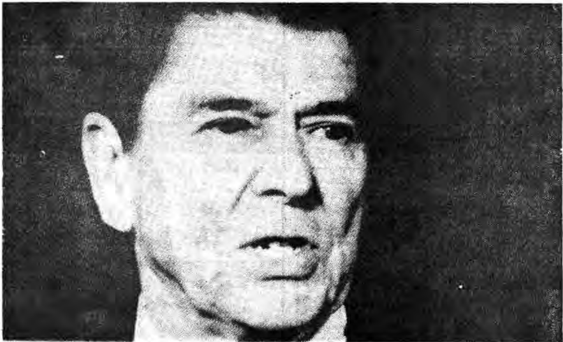
ریگان رئیس جمهور آمریکا