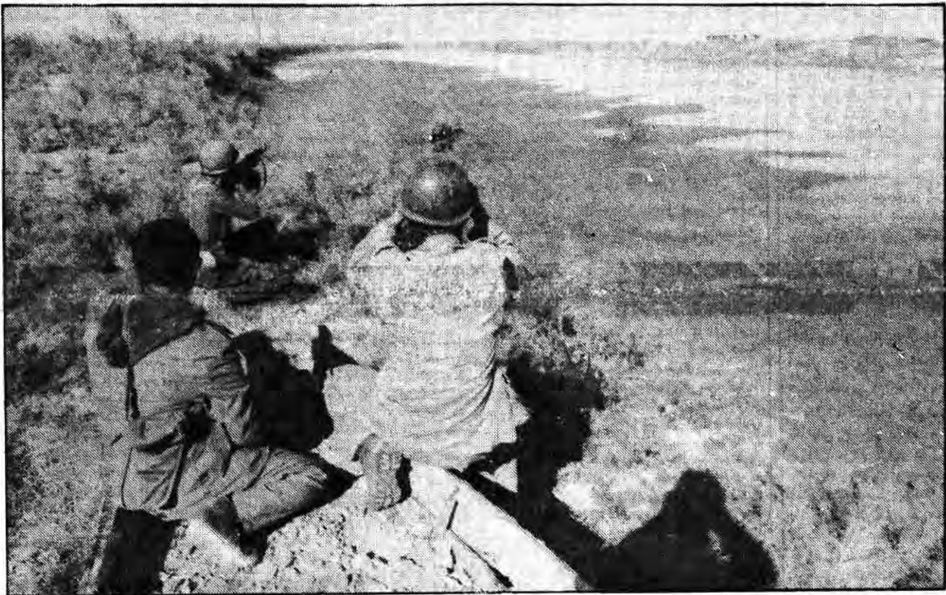
به چنان نظاره گر سنگر خصمند باده بین، عدورا زیر نظر دارند تا با ادا کوچکترین حرکتی از دیده بانی می کنند و زوایای مواضع دشمن را سنجیده و سپس با دادن اطلاعات به گروه آتش دشمن را برای همیشه در آتش می سوزانند. پروردگارا، نگاهبانان و حارسین ایران اسلامی را که بنا به امر تو در راه تحکیم صیانتی اسلام بوسیله مالها و جانهایشان به جهاد برخاسته اند از سر و کیند دشمنان خودت مصون دار

۵۰ تن از قوای کفر در یک عملیات نفوذی بهلاکت رسیدند