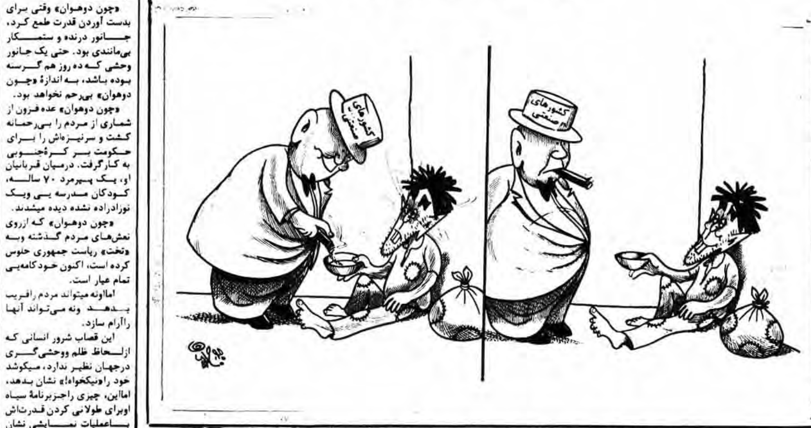
کاریکاتور از روزنامه الشرق الاوسط به اصطلاح کنکهای کشورهای صنعتی به کشورهای جهان سوم