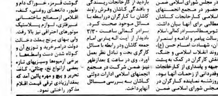
شاخص بهای عمده فروشی پس از حذف نوسانات فصلی در سطحی برابر ۲۲ درصد

در روز رحلت پیامبر گرامی اسلام حضرت محمد (ص) و امام حسن (ع) تا بدعت انجمنهای اسلامی کارخانجات کاشان و وسایع باسناداران انقلاب اسلامی این شهر، جمعه گذشته سران کتکهای تقدی و جنسی کرده که با در اختیار گذاشتن آنها نزد ستاد کتک به جنگ-گنبد نورآباد به جبهه‌ها ارسال شده است. همچنین حدود ۳۰ خانوار جنگ گاز در منازل مسکونی و مهندسی کارخانه سکونت دارند که نهایت کمک و مساعدت از سوی کارکنان به آنها میبشد. سرپرست کارخانه نورآباد ممسنی در بیان ضمن تشکر از همکاری نهادهای انقلابی نظیر جهاد سازندگی، جهاد کشت و حیات ۷ نفره تقاضای همکاری بیشتر از آنها را کرد. نقش کارگران در کتک به پشت این نکته برداریم که مهاجراتی نیز با شورا اسلامی کارگران این کارخانه انجام شده که در اسرع وقت به نظارت میرسد.