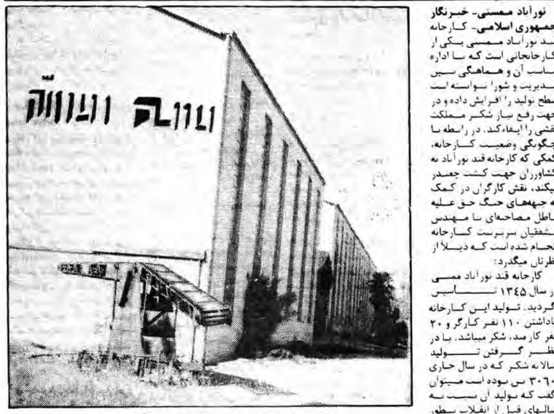
نمایی از قسمت بیرونی کارخانه قند نور آباد ممسنی