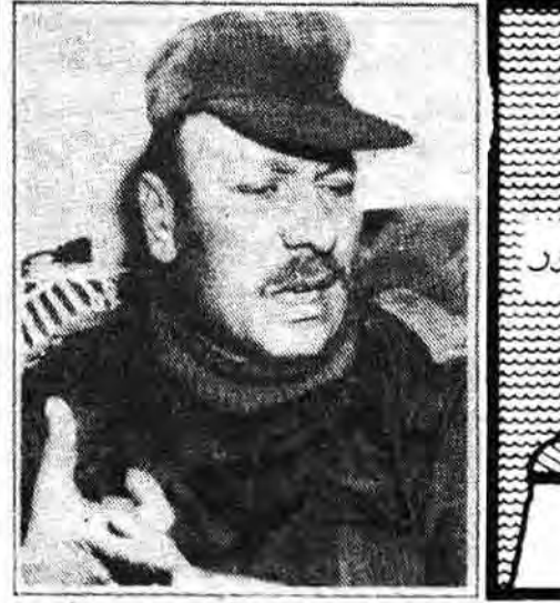
سرگرد سعد حداد در دور صهیونیسم

حضور نیروهایی بین‌المللی و نیروهایی سعد حداد در جنوب لبنان سرگرد سعد حداد در دور صهیونیسم نقشه حضور نیروهایی بین‌المللی و نیروهایی سعد حداد در جنوب لبنان مناخیم بگین مستولین عالی‌رتبه اسرائیل از جمله مناخیم بگین و هم‌چنین اصرار مردم روستاهای «جمهوری لبنان آزاد» استغای خود را پس گرفته است (جمهوری لبنان آزاد، پس از