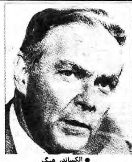
● الکساندر هیک

* امریکا طرح جدیدی برای حل بحران لبنان ارائه کرده که در حقیقت همان طرح موریس درایبر است. * طرح درایبر شامل: انتشار نیروهای بین‌المللی در جنوب لبنان، متمرکز شدن واحدهای ارتش لبنان در جنوب این کشور، خروج مقاومت فلسطین از شهرهای صور و نبطیه و تقویت دولت مرکزی لبنان. * احتمال می‌رود امریکا طرح جدیدی در اوایل سال آینده اعلام کند و وزیر خارجه خود را به منطقه اعزام نماید.