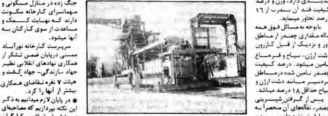
ماشین تخلیه کن یکی از دستگاههای موجود در کارخانه قند ممسنی

رابطه عمومی وزارت ترویج کشاورزی در گرگان و گنبد اداره کل کشاورزی استان مازندران در زمینه ترویج کشاورزی در منطقه گرگان و گنبد طی آستانه سال جاری قرارداد طرح افزایش تولید گندم با کشاورزان و شوراها امضاء شده است. همچنین ۵۰۰۰ هکتار در این منطقه منقد کرده است. همچنین این اداره کل طی مدت یاد شده اقدام به تحویل قدر گندم اصلاح شده به کشت کاران گندم میبازد. ۷۴۹۸-۵۰ کیلوگرم را انجام داده است. اداره دیگر فعالیتهای ترویجی کشاورزی در منطقه گرگان و گنبد متون از فعالیتهای ارضانی و طرق مختلف بکاربردن در کبید راه کشاورزان نام برد. مبارزه با آفات نباتی در زابل اداره کشاورزی و عمران روستائی استان اعلام کرد بعد از پیروزی انقلاب اسلامی تاکنون توسط مأمورین این اداره در مسطح ۶ هزار و ۶۰۰ هکتار از زمینهای منطقه سیستان بالوابع آفات نباتی از قبیل قمل بومی، موش صحرائی و آفات راعی مبارزه شده و باوافتات آبیاری یازده هزار و ۶۰۰ تن ازغات مبارزه شده است.