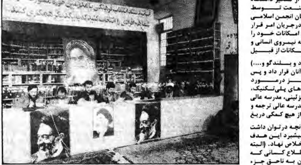
گزارش‌های دریافت شده از کمیسیونها