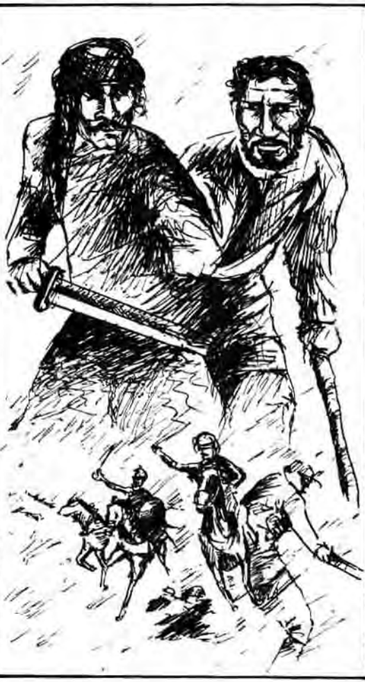
زینت قافه شد...