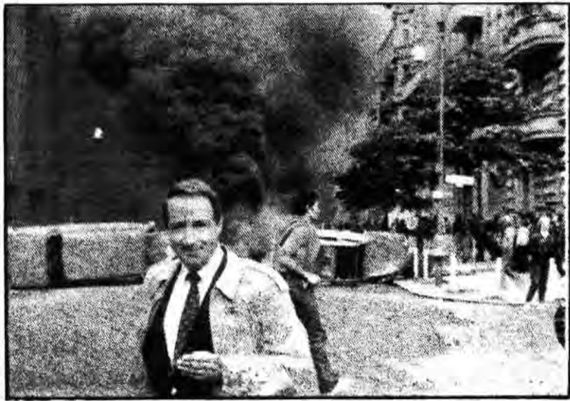
از تظاهرات خشونت آمیز علیه آمریکا در آلمان فدرال

دوستی شدیدی دارد و نه هیچ وجه حاضر نیست از او انتقاد بعمل بیاورد، سایر رهبران دولت ریگان جانبدار مسلح شدن غرب با سلاحهای مدرن و پیشرفته هستند. ولی دولتهای اروپا که از جانب ملت‌های خود سخت در زیر فشار قرار گرفتند، خواهان آغاز مذاکرات پایانی مسابقات تسلیحاتی می‌باشند.