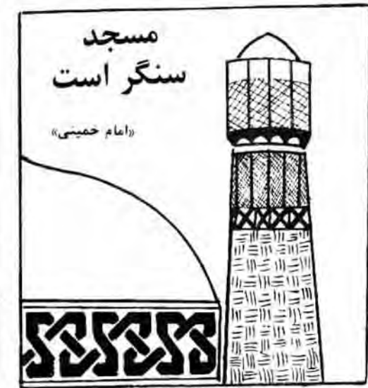
مسجد سنگر است (امام خمینی)

مکانهای ویژه مسلمانان در کنار هم برادر وار به تحصیل علم و معارف اسلامی می پردازند و نیز در امورهای مختلف زندگی به همکاری می پردازند.