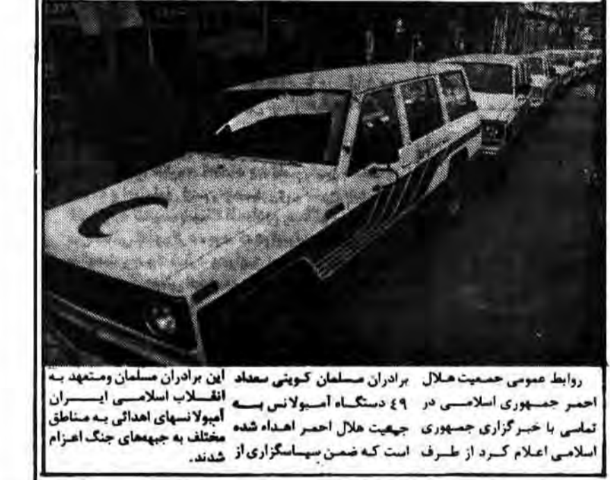
۴۹ اسبوالانس توسط مسلمانان کویت به ایران اهدا شد