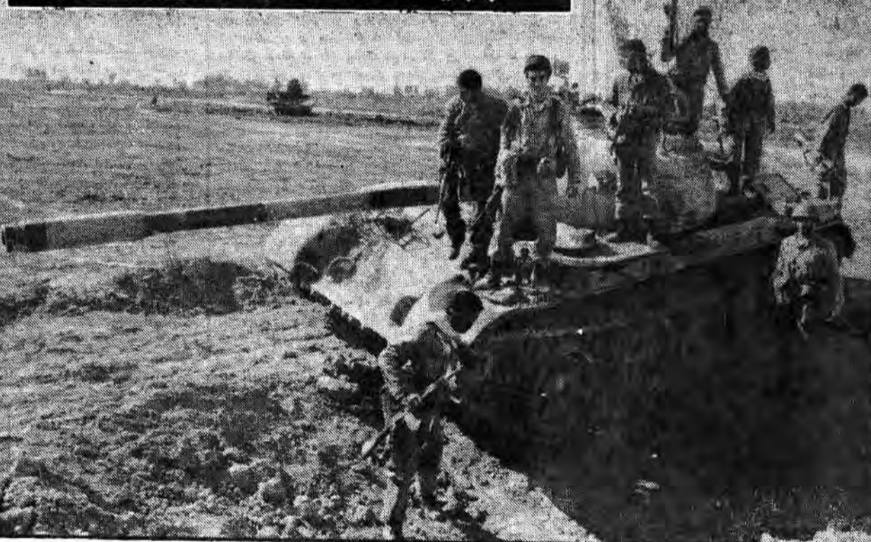
عرصه گرم و نقدیده خوزستان اینک پس از ۱۶ ماه نبرد سراسر حماسه می‌رود تا از لوث وجود اجانب پاکسازی شود. هم اکنون اسلام پناهان جبهه حق در این سرزمین، آنها که بحق شیران غرنده روز و پارسایان تالان شیند، با افتخار آفرینی و استعداد از نیروی معنوی می‌روند تا واژه تجاوز را برای همیشه از واژه‌نامه‌ها بزدایند

● ۳۰۰ تن از مهاجمین و صدامیان و ۱۰ تانک دشمن در جبهه دالاهو نابود شدند