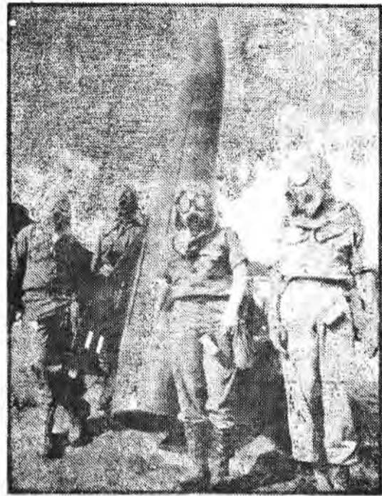
آماجی برای جنگ های شیمایی

برای مسائل فضائی ثابت میکند که تنها مسائل علمی نیست که توجه بر قدرت‌ها را جلب کرده بلکه هدفهای دیگری هستند که دنبال میشوند.