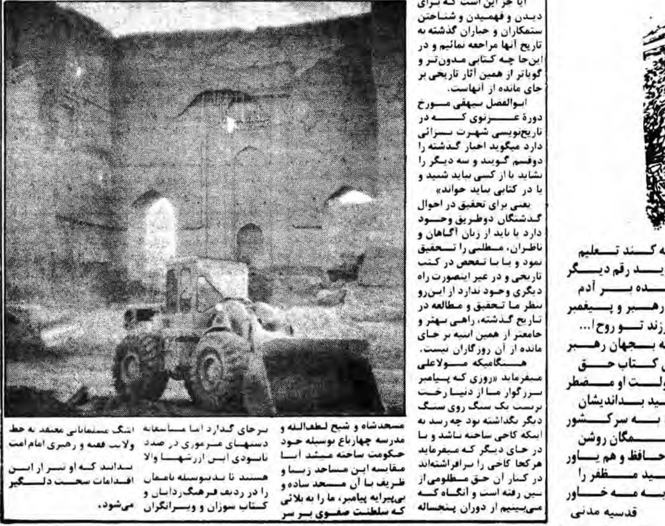
سرجای گدار اما مسافحه اشک سلطانی معشقه به خط ولایت فقه و رهبری امام امت ناسودی این اثرشما والا

حکومت عدالت گستر علی (ع) حتی یک سناي ساده هم برای معاندان است انوقت درمی‌یابیم که هیچ کتابی برای شناختن ۲۲۰ سال استعمار مردم و ملل مختلف بوسیله هخامنشیان بهتر از همین خرابه‌های سرجای سمانه تخت جمشید نیست و زمانیکه در دوران حکومت صفوی برای استعمار مردم، نخست به استعمار آنان می‌پردازند و آنها را به نام دین می‌فریبند در حالیکه از اسلام محمد (ص) و تشیع علوی و اناسکی به سخره‌های فرهنگی عبراسلامی و ایرانی به پیش رود و این شانسگی را بخان داد ک... که مسواند از خود نام یک کاشیکارها همچون