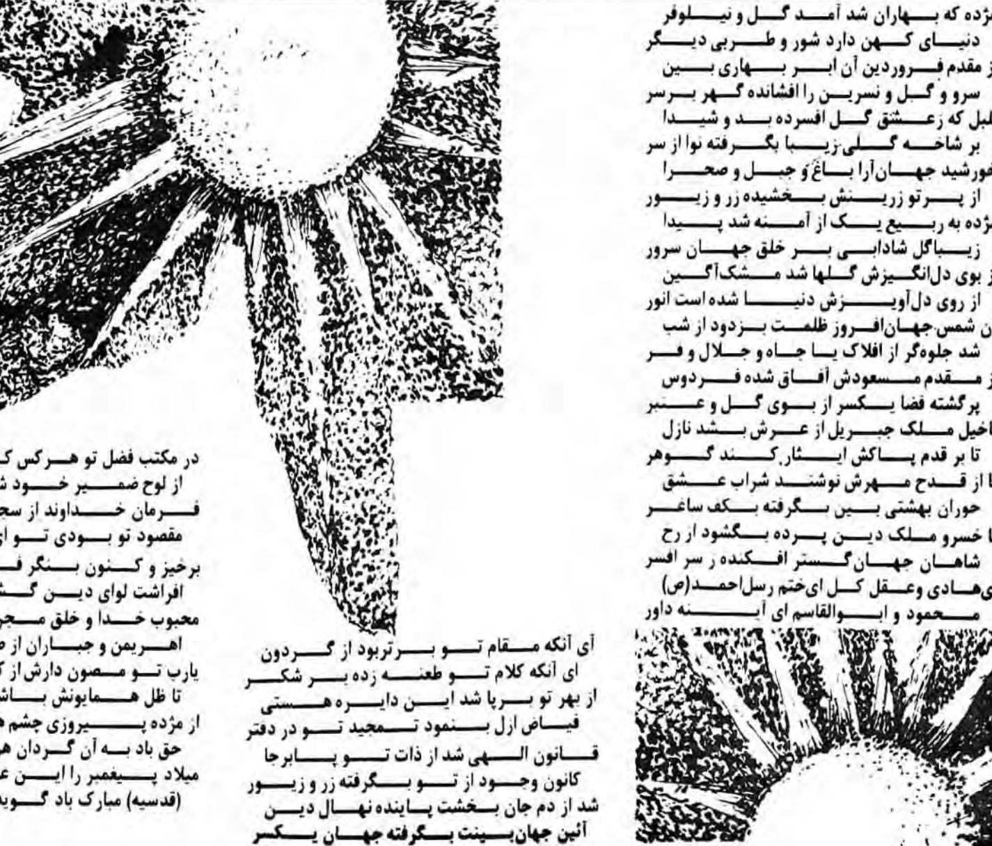
در مکتب فضل تو هر کس که کند تسلیم از لوح ضمیر خود شوید رقم دیگر فرمان خداوند از سجده بر آدم

مژده که بهاران شد آمد گل و نیلوفر دنیای کهن دارد شور و طبری دیگر از مقدم فروردین آن ایبر بهاری بسین سرو و گل و نسرين را افشانه گهر برسر لبیل که ز عشق گل افسرده بند و شیدا بر شاخه گلی زیبا بگرفته نوا از سر خورشید جهان آرا باغ و جیل و صحرا از پستو زربش خشنیده زر و زیور مژده به ربیع یک از آسنة شد پیدا زیبا گل شادابی بر خلق جهان سرور از بوی دل انگیزش گلها شد مشک آگین از روی دل آویزش دنیا شده است نور آن شمس جهان افروز ظلمت بزود از شب شد جلوه گر از افلاک یا جاه و جلال و فر از مقدم مسعودش آفاق شده فردوس پرگشته فضا یکسر از بسوی گل و عنبر باخیل ملک جبریل از عرش بشد نازل تا بر قدم پاکش ایثار کنند گوهر تا از قدح مهرش نوشند شراب عشق خوران بهشتی بسین بگرفته سناغر تا خسرو ملک دین برده بگشود از رخ شاهان جهان گستر افکنده ر س افسر ای هادی و عقل کل ای ختم رسل احمد (ص) محمود و ابوالقاسم ای آینه داور