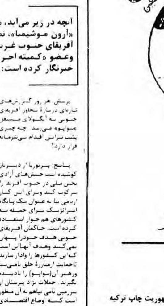
دنیای بر روی شاخ گاوا! کاریکاتور از جمهوریت چاب ترکیه