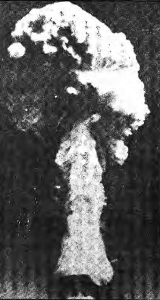
انفجار بمب هسته‌ای

* طراحان نظامی پیش‌بینی میکنند امکان دارد در آینده پایگاه نظامی در سطح ماه مستقر گردد و بتواند هدفهای زمینی را مورد هدف قرار دهد. * در ایالات متحده آمریکا انبارهای بزرگی حاوی گازهای سمی وجود دارد که اخیراً کنگره آمریکا افزایش ساختن آنرا متوقف کرد.